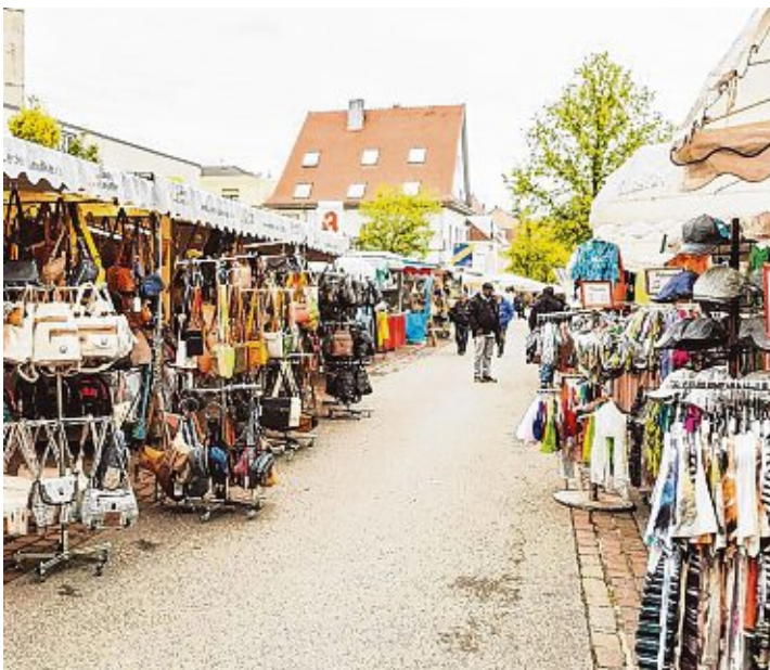
Dieses Wochenende lädt die Gottmadinger Ortsmitte zum Bummeln ein

Der Frühjahrsmarkt in Gottmadingen hat an beiden Tagen von 11 bis 18 Uhr geöffnet. Zusätzlich öffnen die örtlichen Läden am Sonntag von 12 bis 17 Uhr ihre Türen.