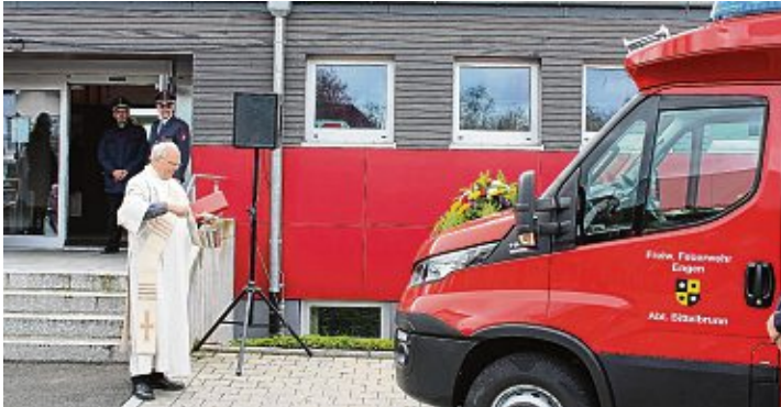
Segen für Fahrzeug und Besatzung: Diakon Pirmin Späth weihte das neue Feuerwehrgefährt der Wehr Bittelbrunn.

Das neue TSF-W Bittelbrunn wurde geweiht und mit einem großem Fest gefeiert