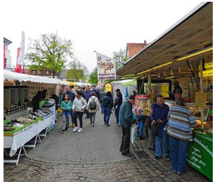
Bei schönem Wetter schaut es sich besser. Letztes Jahr hatten die Gottmadinger weniger Glück.