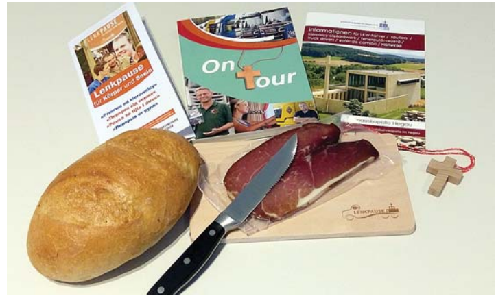
Mit Vespertüten und Flyern wurden bei der zweiten »Lenkpausen«-Aktion rund 100 Fernfahrer beschenkt.