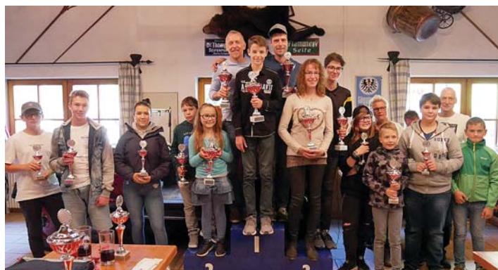
Die BKC-Gesamtsiegerehrung fand in der Lochmühle statt.

Im Ganzen stellte der AC Engen mit seinen FahrerInnen das größte Starterfeld der abgelauften Saison und konnte diese als zweitbester Verein beschließen. Der AC Engen hofft auf eine genauso erfolgreiche Saison im kommenden Jahr. Denn: Nach dem Rennen ist vor dem Rennen.