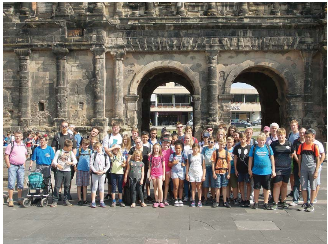
Abwechslungs- und erlebnisreiche Tage verbrachten die Ministranten aus Mühlhausen und Grenzach-Wyhlen bei ihrem Sommerlager im Freizeithaus Kelberg in der Eifel.

Redaktions- und Anzeigenschluss Montag 12 Uhr