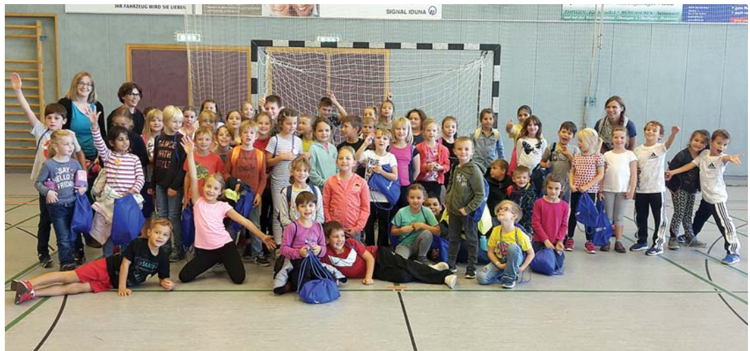
Mehr als 60 Zweitklässler waren mit Spaß und Ehrgeiz beim Handball-Grundschulaktionstag bei der Sache.

Die Bewirtung für Jung und Alt übernimmt der Elternbeirat des Kindergartens nach dem Martinsspiel an der Welschinger Grundschule.