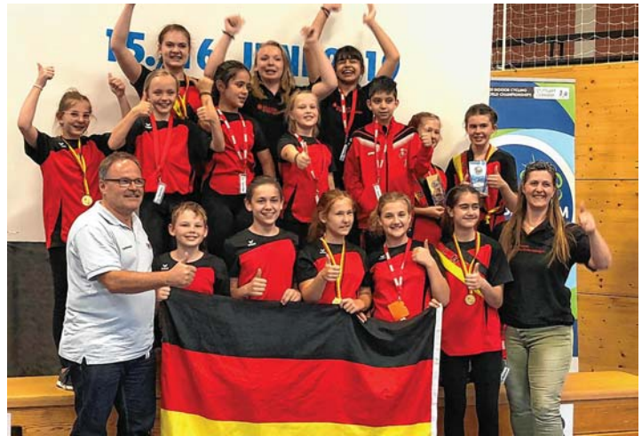
So sehen Sieger aus: die glücklichen Goldmedaillengewinner des RMSV Edelweiß Aach, zu denen auch junge SportlerInnen aus Engen zählen.

Ergebnisse: https://www.rad-net.de/dt.-meisterschaften_1.htm .