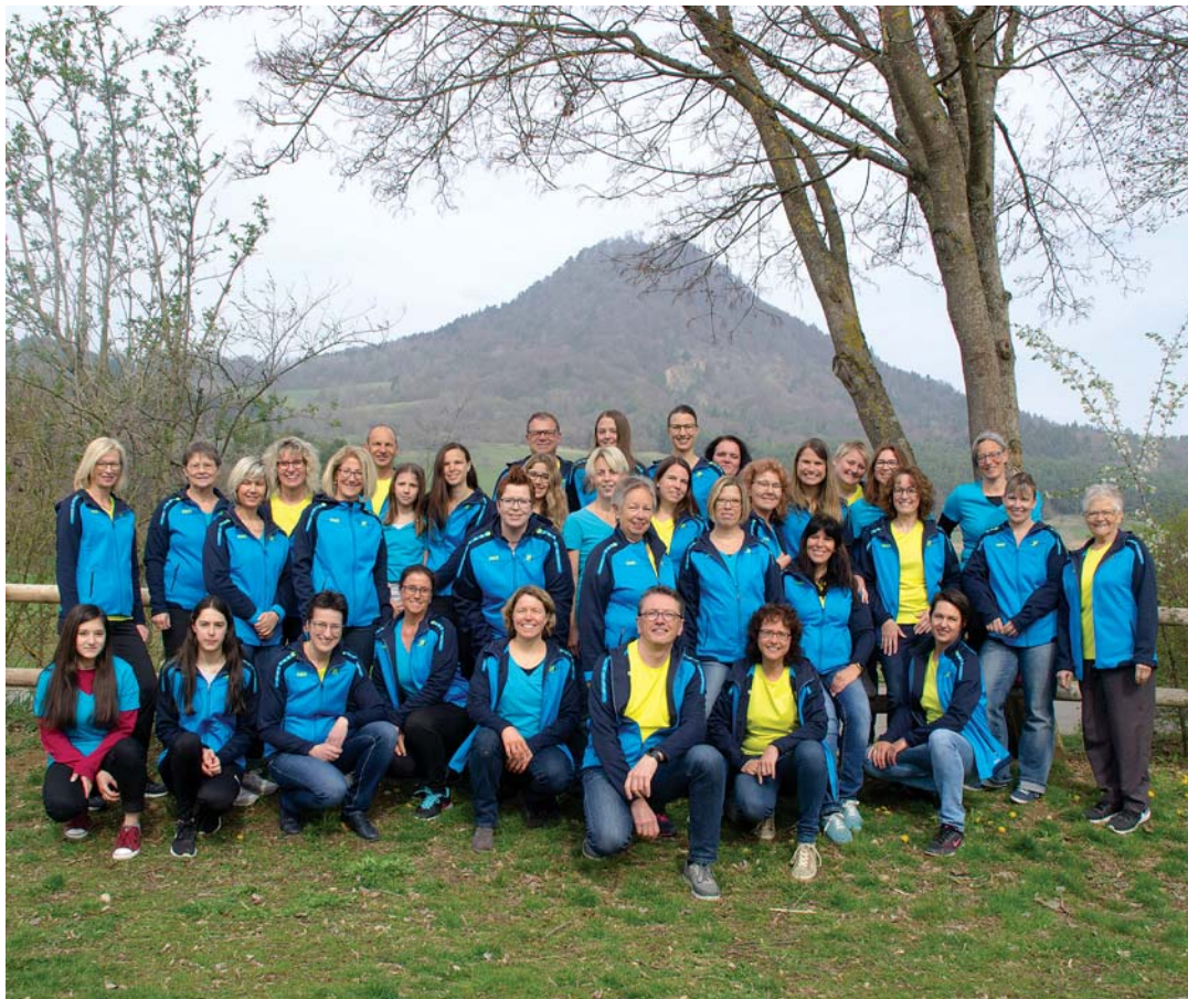
Das 50-jährige Bestehen der Turn- und Gymnastikgemeinschaft Welschingen wird am Freitag mit einer Jubiläumsparty und am Sonntag mit einem großen Sporttag gefeiert. Der Vorstand und die Übungsleiter sowie Helferinnen und Helfer freuen sich auf viele Besucher.