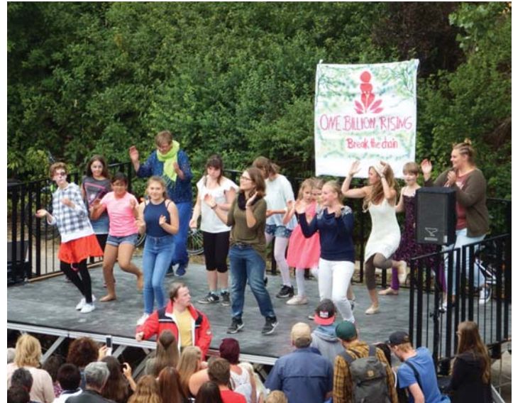
Mit Tänzen sorgen auch die Mädchen vom »Haus am Mühlebach« für tolle Stimmung bei »Sound am Bach« am 6. Juli.