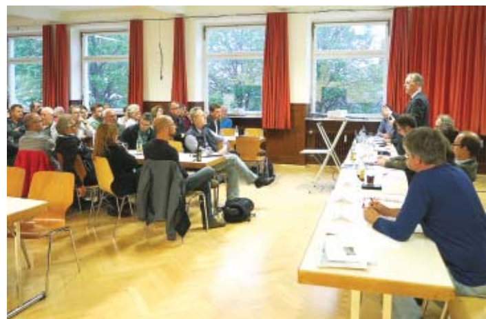
Neuhausen erhält einen Hochwasserschutz. Bei der Bürgerversammlung in der vergangenen Woche wurden die Bürger darüber informiert.