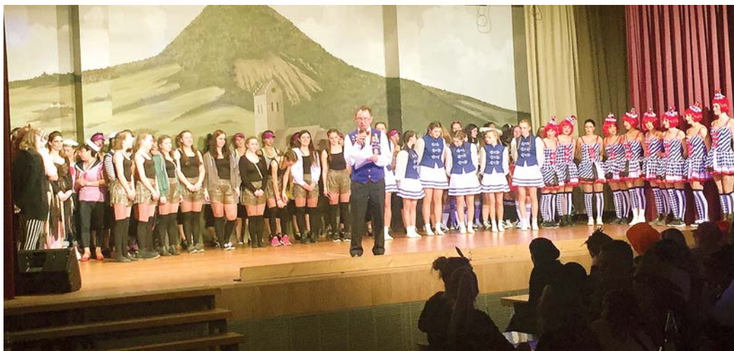
Ein buntes Bild boten beim Finale des Garde- und Showtanz-Abends die teilnehmenden Gruppen.