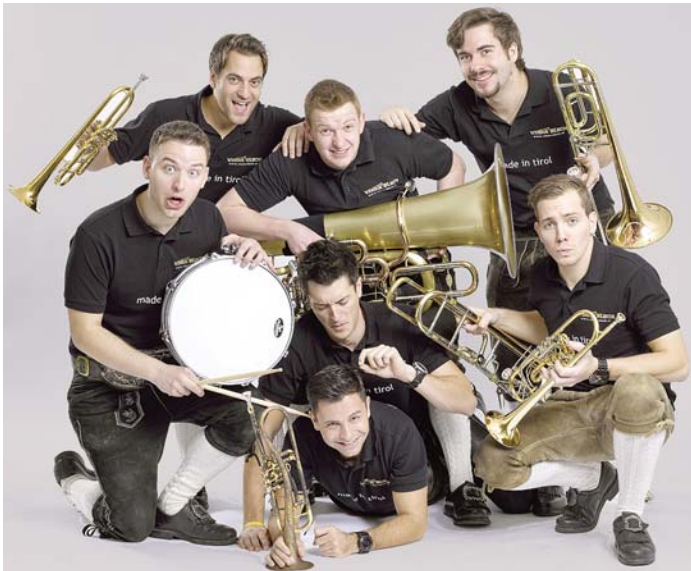
Die Blasmusikformation »Viera Blech« aus Tirol wird am kommenden Samstag, 11. März, im Rahmen des Bezirksmusikfestes in der Neuen Stadthalle in Engen zu Gast sein.

Amtsblatt der Stadt und der Verwaltungsgemeinschaft Engen