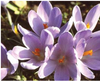
Krokusblüten - untrügerisches Zeichen des Frühlings im Naturgarten.

Engen. Der Engener Frauenhock lädt alle interessierten Gärtnerinnen morgen, Donnerstag, 9. März, in die Gaststätte »Gaugelmühle«, Mundingstraße 6, zu einem interessanten Vortrag mit Sibylle Möbius, Fachwartin für Obst- und