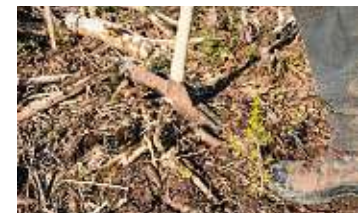
Eine frisch gepflanzte kleine Libanonzeder.

deutschland angekommen ist. Verschiedene Wissenschaftler raten von einer Ahorn-Pflanzung im größeren Stil ab. Als Hoffnungsträger gelten im Zeichen des Klimawandels die Douglasie, die Eichenarten, Hainbuche, türkische Tannen, Baumhasel und Zedern. Kein Wissenschaftler kann vorhersagen, ob solche bisher nicht heimischen Baumarten nicht einen bisher unbekanntem Schädling bekommen und sich irgendwann als Flop herausstellen. Ideal wäre es, wenn man solche Versuche nicht bräuchte und bei den erprobten, bewährten heimischen Baumarten bleiben könnte. Da dieser Wunsch wohl Illusion bleibt, wurden schon seit Jahren im Stadtwald »türkische Tannen« (abies bornmülleriana, abies equi trojana) und erstmals auch Libanonzedern ausgebracht. Der Forstbetrieb hofft auf gutes Gedeihen und viel Widerstand der neuen Baumarten bei sich wandelndem Klima.