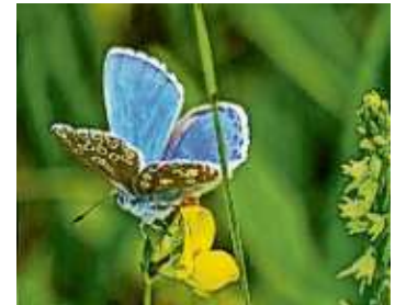
Ein blau-grüner Bläuling und ein braun gefleckter Bläuling.

Redaktions- und Anzeigenschluss Montag 12 Uhr