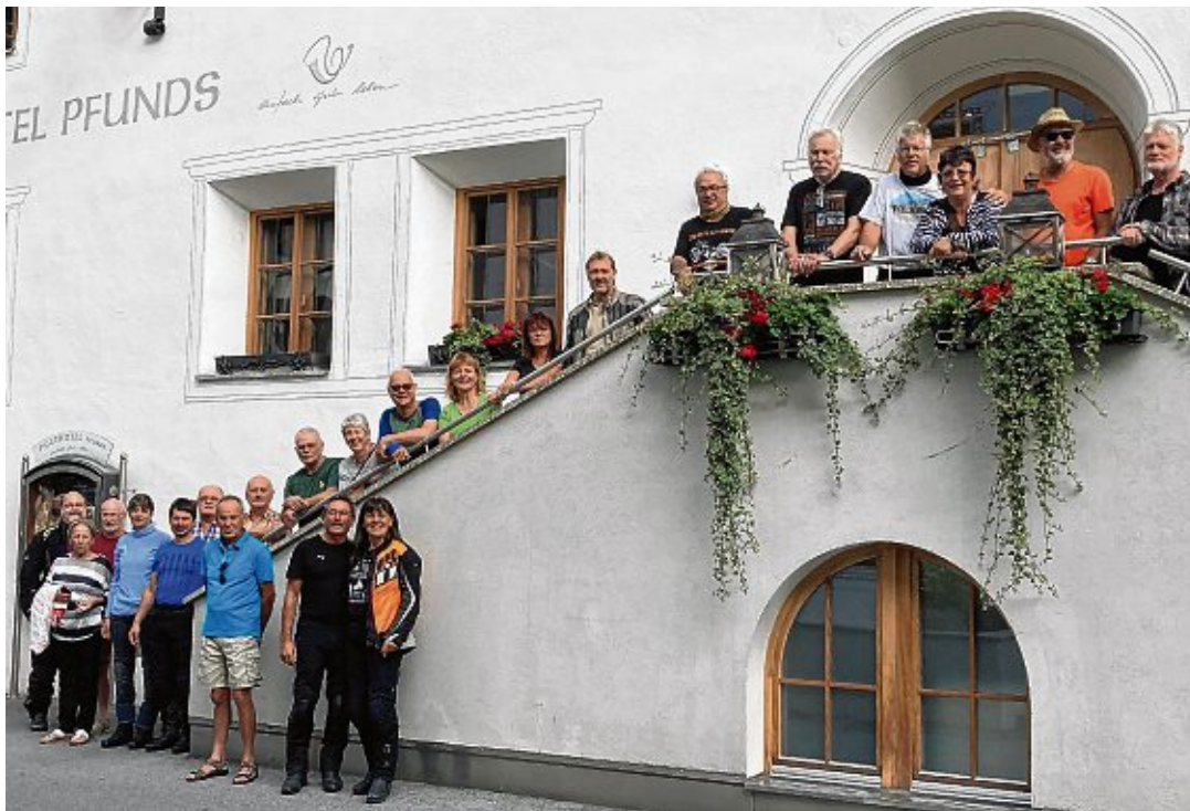
Rundum zufriedene Gesichter waren bei den Teilnehmerinnen und Teilnehmern des gelungenen Motorrad- und Wanderwochenendes des Schwarzwaldvereins Engen Ende August zu sehen.