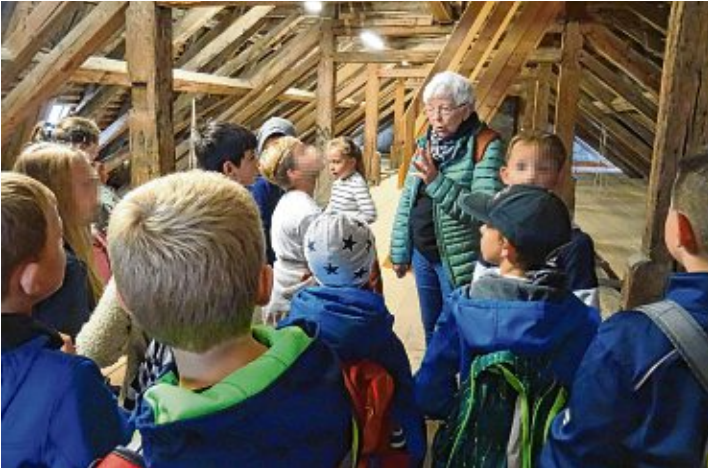
In der katholischen Kirche durften die Kinder auf den Dachboden und erkundeten auch den vorderen Kirchenbereich.