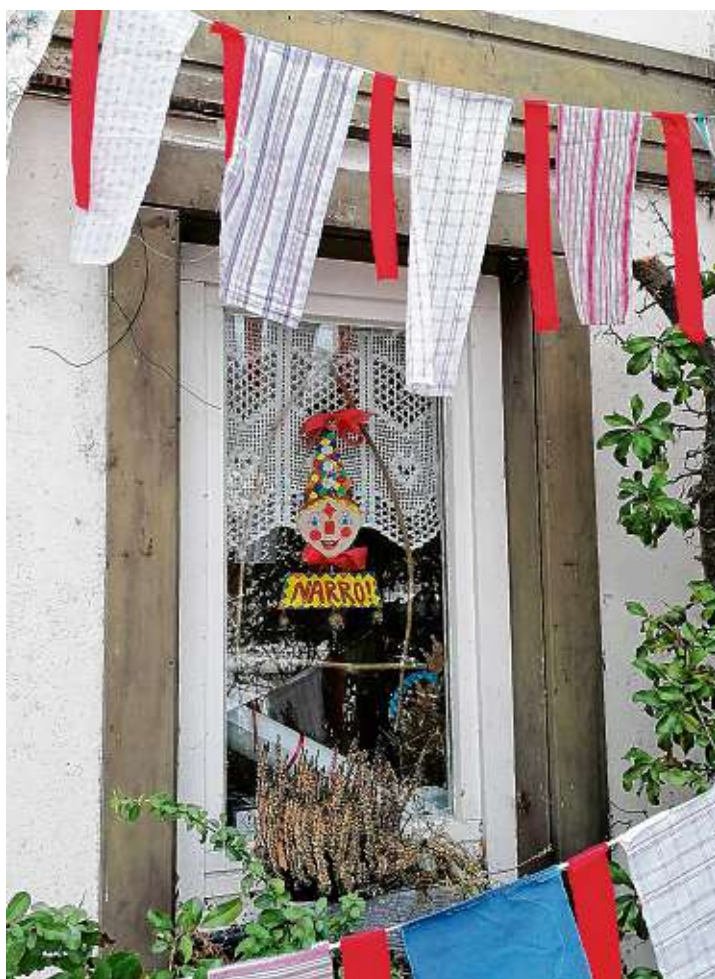
Die ersten Stationen des »Holzklötzle-Spazierwegs« sind in Zimmerholz bereits zu sehen.