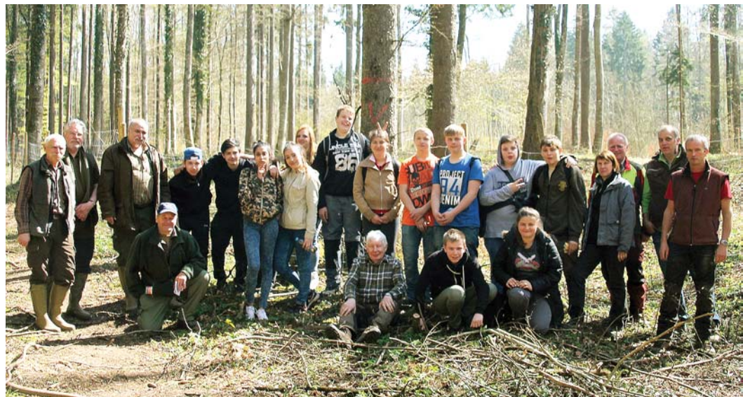
Fleißig war die Klasse 8b der Werkrealschule des Anne-Frank-Schulverbunds bei ihrer Waldaktion mit dem Forstbetrieb der Stadt Engen und den Jagdpächtern des Jagdreviers Barga-Duttenbühl.

Bittelbrunn. Die Bittelbrunner Abteilung der Freiwilligen Feuerwehr Engen trifft sich am Mittwoch, 11. Mai, um 20 Uhr am Gerätehaus zu einer Probe.