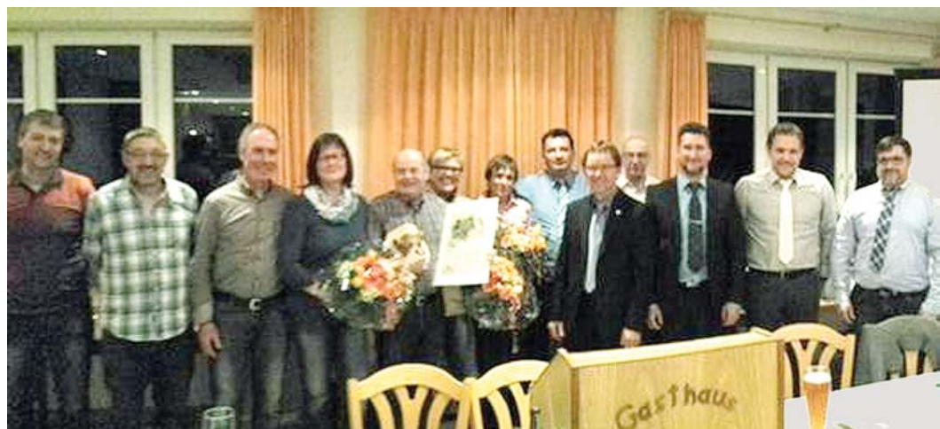
Die bisherige und neue Vorstandschaft der Rollizunft Welschingen versammelte sich nach der Generalversammlung zum Foto.