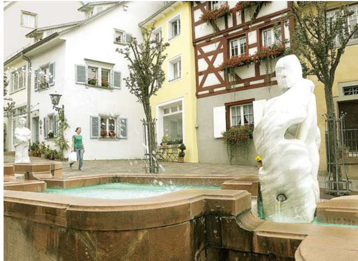
Vorstadtbrunnen von Lutz Brockhaus.

So fühlen sich gerade die jüngsten Zuschauer an die Hand genommen und bekommen auch ganz aktuelle Themen vermittelt, wie etwa der Lebensalltag illegal in Deutschland lebender Immigranten oder die Probleme von Scheidungskindern.