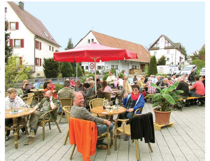
Für leckere Bewirtung ist beim Altdorf-Erlebnis-Sonntag an mehreren Stellen gesorgt.