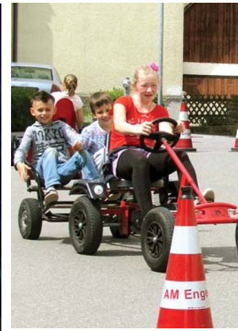
Ein Go-Kart-Parcours bietet den jungen Besuchern Abwechslung.