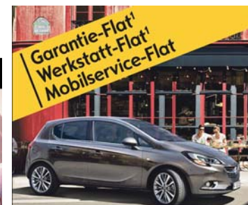
Abbildung zeigt Sonderausstattung.

Donaueschingen, Villingen, Schwenningen, Titisee-Neustadt, Waldshut-Tiengen, Singen und Konstanz www.suedstern-boelle.de info@suedstern-boelle.de