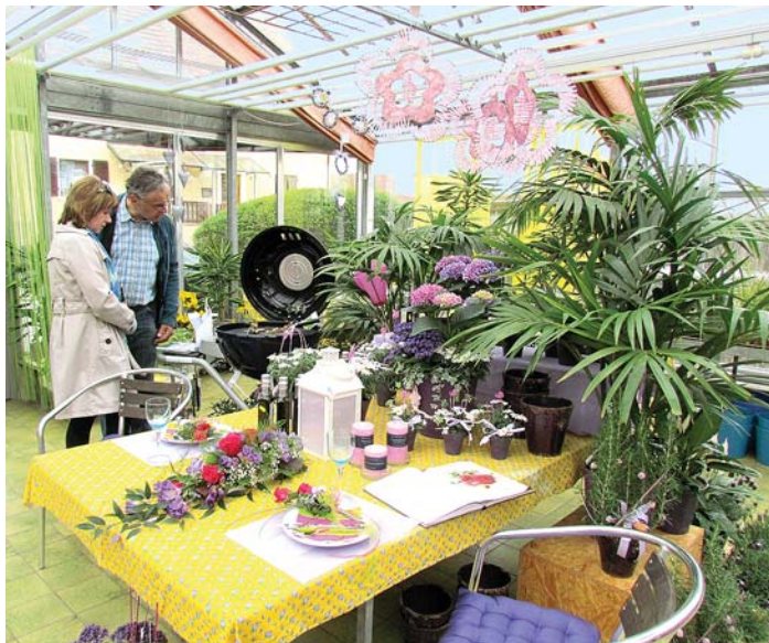
Zu einem »Tag der offenen Gärtnerei« lädt Blumen Weggler im Rahmen des Altdorf-Erlebnis-Sonntags ein.