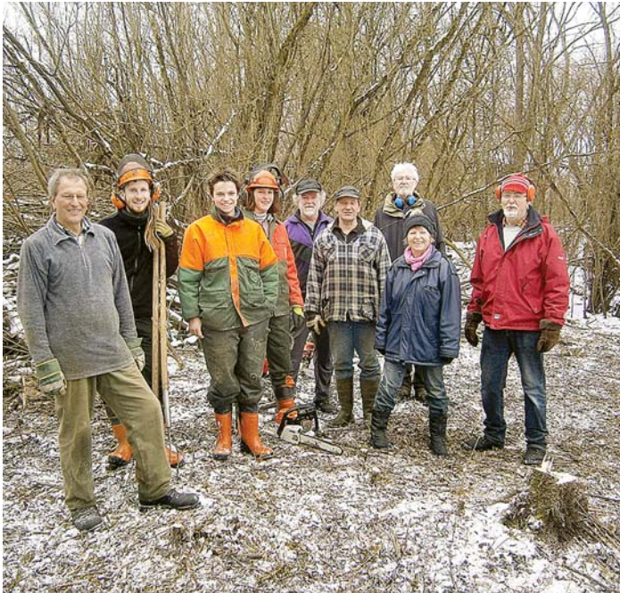
Bereits dreimal trafen sich Mitglieder der BUND-Ortsgruppe Engen/Mühlhausen-Ehingen, um mit Unterstützung des BUND-Naturschutzzentrums Gottmadingen in der ehemaligen Kiesgrube beim Bleichehof in Welschingen geeignete Entbuschungen vorzunehmen.