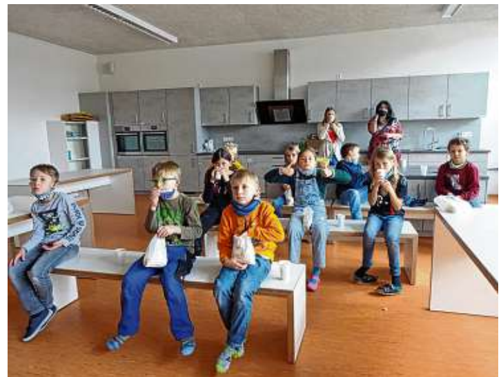
Zum Abschluss durften die Kinder einen Film anschauen. Popcorn und Apfelpunsch durften da natürlich nicht fehlen.