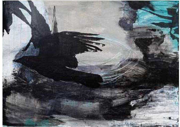
Sibylle Möndel, #201849 | Malerei und Siebdruck auf Museumskarton | 2018.

Anmeldungen bis zum Veranstaltungstag um 16 Uhr bitte per Mail an konstanz@vhs-landkreis-konstanz.de .