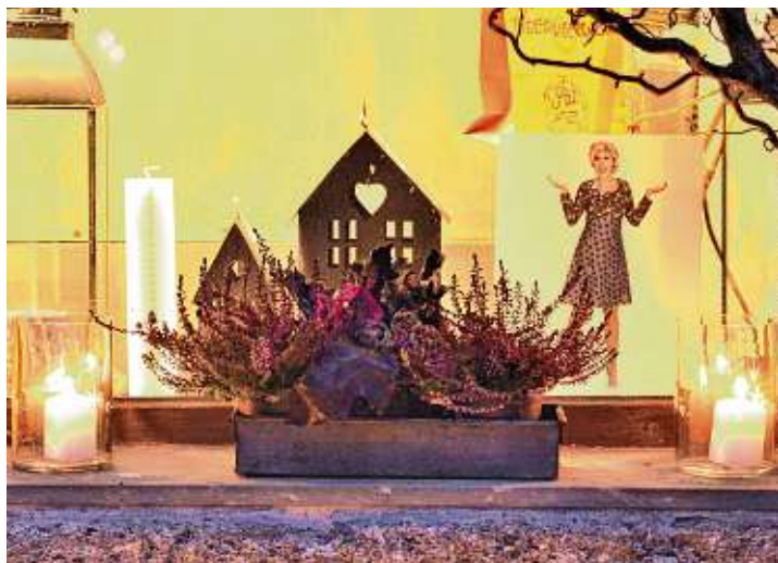
Die Stadt Engen und die örtlichen Kirchen rufen zu einer gemeinsamen Adventsaktion gegen den »Corona-Blues« auf. Ob Lichterketten, Krippen, Sterne, Kerzen oder Fensterbilder - der Kreativität sind keine Grenzen gesetzt.