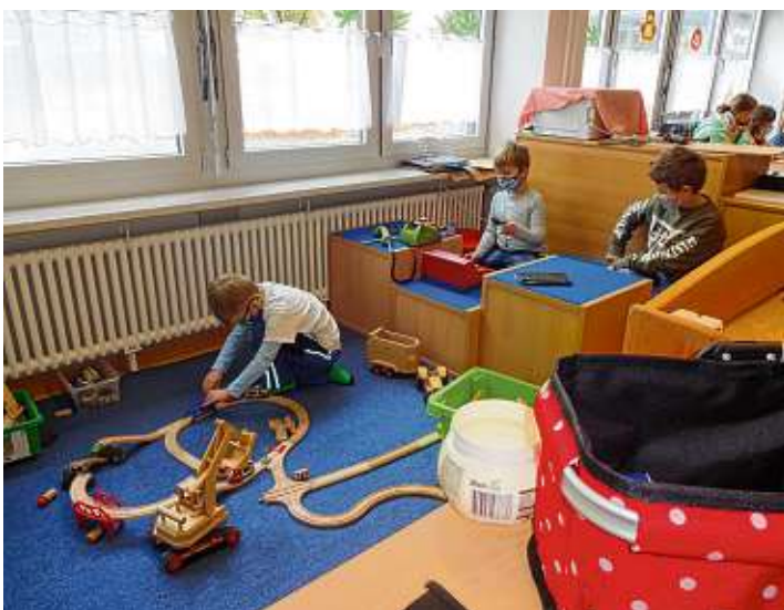
Für ausreichend Bewegung sorgte das Sportangebot, und das freie Spielen kam ebenfalls nicht zu kurz.