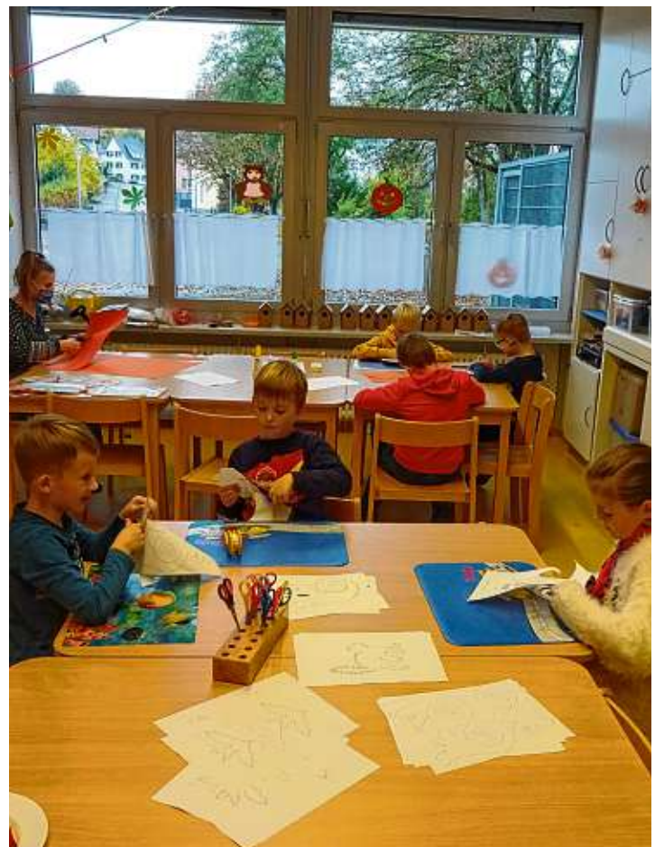
Hier wurde ein Weihnachtsmobile mit Filzherzen und Tannenbäumen gebastelt. Die fertigen Mobiles wurden für die Eltern als Geschenk für die Weihnachtszeit verpackt.