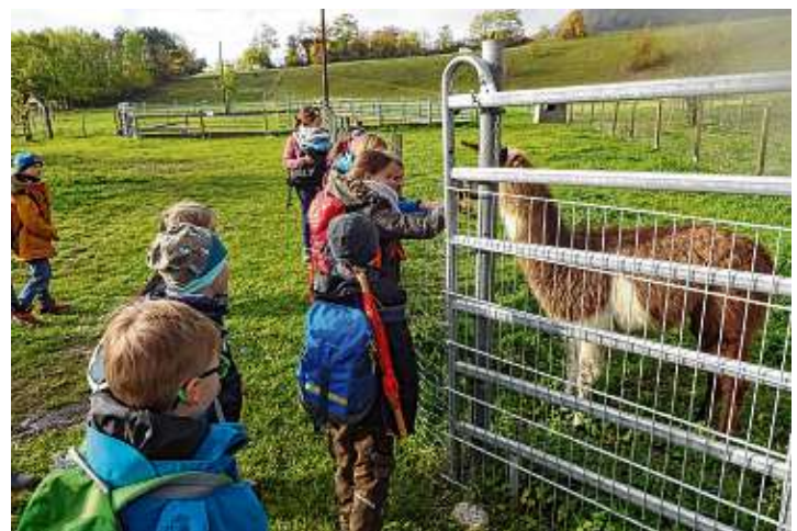
Ein Ausflug zum Alpakahof der Familie Pahoki zwischen Engen und Welschingen stand auch auf dem Programm. Die Kinder erhielten eine Führung über den kompletten Hof. Die verschiedenen Tiere, Alpakas, Lamas, Vögel, Pferde und auch Hängebauchschweine bereiteten den Kindern viel Freude.