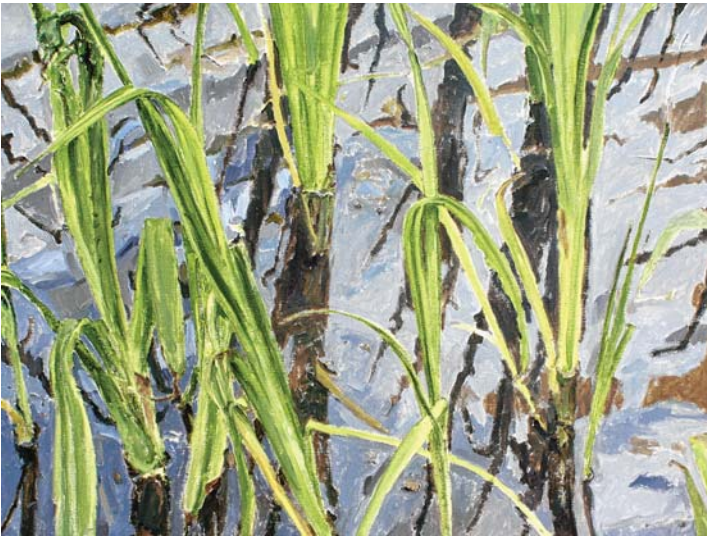
Renate Gaisser, Sumpflilienkraut 8, Öl/Leinwand, 2017.