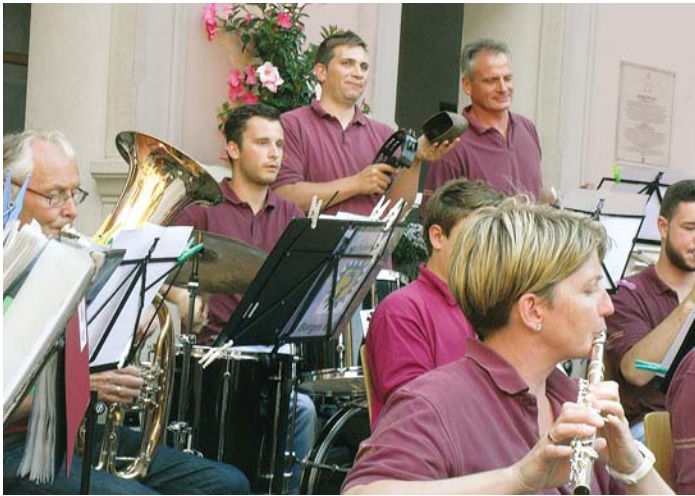
Am 14. Juni beginnen die beliebten Feierabendkonzerte auf dem idyllischen Marktplatz in Engen. Zum Auftakt spielt der Musikverein Bargaen.