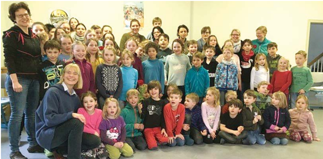
Ein Höhepunkt der intensiven Probenarbeit für das Kindermusical »Aljoscha und der eine Ton« war ein Wochenende in Bittelbrunn zusammen mit vielen Eltern, an dem alle Teilnehmer an Workshops in Gesang, Tanz und Kulissenbau teilnahmen.