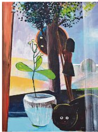
Gunilla Jähnichen, Sommer, Acryl/Leinwand, 2018. Bild: Künstlerin

Mit den Worten der Künstlerin: »Diese Wesen können Menschen, meistens Kinder, mal Mädchen, mal Junge, mal könnte es beides sein. Diese Wesen können auch Tiere sein. Die Wesen können aber auch in eine fabelhafte Welt abgleiten, sich in einfache Formen auflösen oder zu einer Masse oder Substanz werden. Sie wirken geisterhaft, wie aus einer magischen Welt. Manchmal sind noch Augen da, die auf ein Wesen mit Leben und Seele hinweisen, mal löst es sich ganz in eine nur noch farbige Fläche auf.«