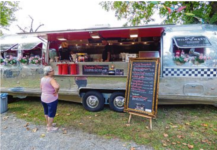
Von Klassikern bis zu Ausgefallenem und Exotischem war auf dem Streetfood-Markt im Alten Stadtgarten alles dabei.

Baumstriezel, Kässpätzle - da war für jeden etwas dabei. Bei angenehmen Temperaturen luden die Bänke zu gemütlichem Beisammensein ein und auch für die Kinder war etwas geboten, ein Karussell drehte seine Runden. Die gelegentlichen Schauer hielten die Gourmets nicht davon ab, sich durch den Alten Stadtgarten zu schlemmen. Nun wird sich zeigen, ob die mit Leckereien gefüllten Wagen nächstes Jahr wieder nach Engen kommen und die Hosen etwas enger machen.