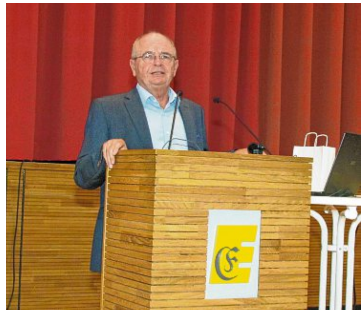
Bei umfangreichen Recherchen im Engener Stadtarchiv und in Gesprächen mit einigen alteingesessenen Engenern fand Kreisarchivar i. R. Wolfgang Kramer eine ganze Reihe von Opfern der unmenschlichen Gewalthaber des Nazi-Regimes. Im Rahmen eines Vortrags stellte er die Lebensgeschichten vor.