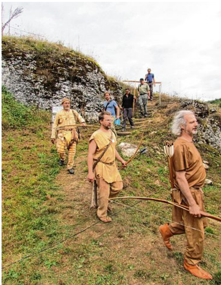
Bei den im Rahmen der Petersfelstage stattfindenden »Europameisterschaften für prähistorische Jagdwaffen« gilt es für die Teilnehmerinnen und Teilnehmer, einen anspruchsvollen Parcours zu bewältigen. Richtige Steinzeitfreaks treten sogar in entsprechender Kleidung an.

Der älteste Fund eines Jagdbogens stammt aus Dänemark und ist mehr als 8.000 Jahre alt. Die Technik des Bogenschießens dürfte jedoch viele Jahrtausende älter sein. Bogen wurden meist aus dem Holz der Ulme oder der Eibe hergestellt. Im alpinen Bereich ist für die Jungsteinzeit, als die Menschen sesshaft wurden und in erster Linie Bauern waren, überwiegend ein schlanker Bogen ohne speziell herausgearbeitetes Griffteil nachgewiesen. Als Bogenholz wurde auch hier in der Regel Eibe verwendet.