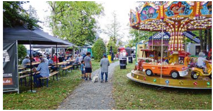
Auch wenn das Wetter am vergangenen Wochenende nicht immer mitspielte, war der Streetfood-Markt gut besucht und lockte mit einer Vielzahl von Leckereien.