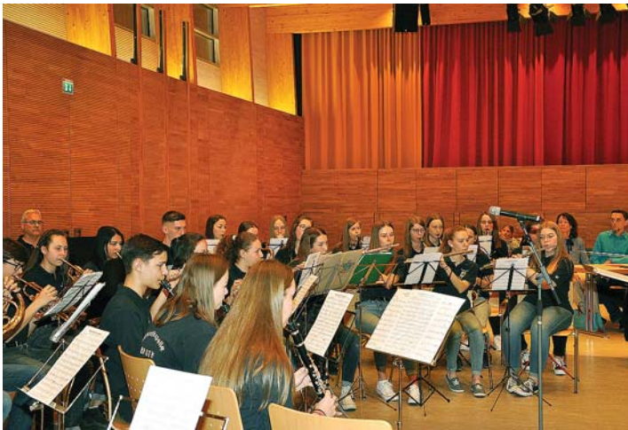
Eröffnet wurde das Konzert von der Jugendkapelle der Stadtmusik. Sie nimmt am kommenden Sonntag, 7. April, um 11.30 Uhr in der Aula der Realschule in Stockach am Jugend-Wertungsspiel teil.