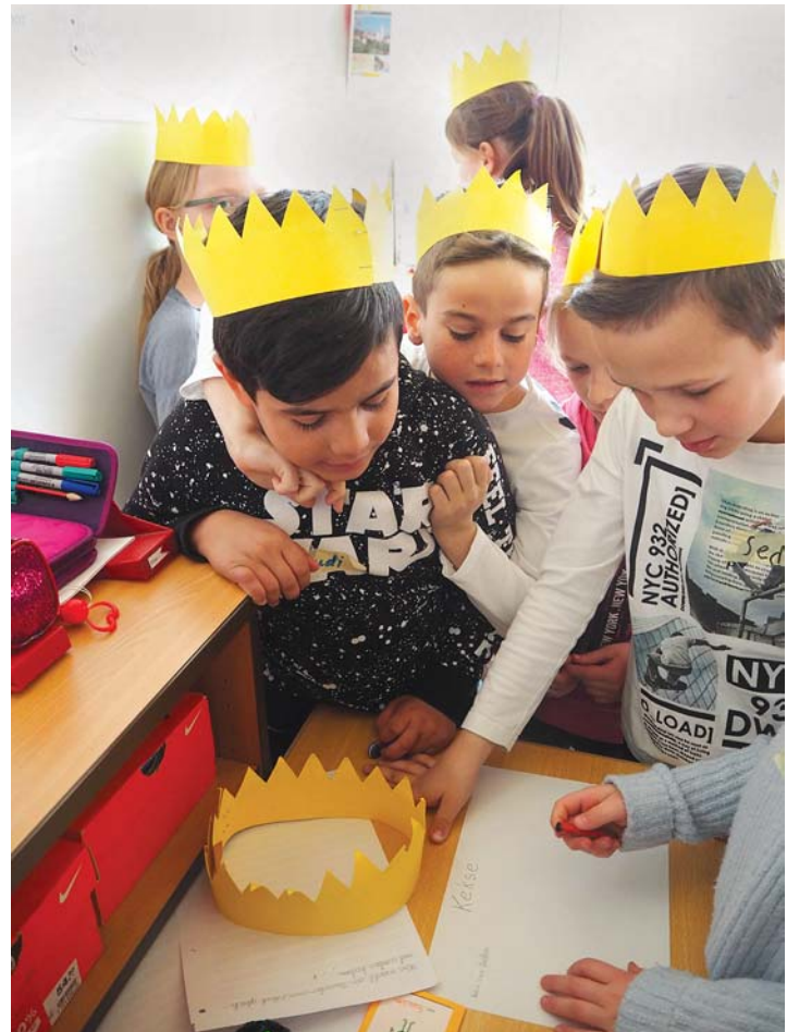
Eifrig suchten die »Parteimitglieder« Argumente für ihre Lieblings-Süßigkeit, die sie anschließend dem Publikum vortragen mussten.

Nach der Pause gingen die beiden Leiter noch auf die Funktionen und Aufgaben des Gemeinderats und der Verwaltung ein. Mit ihrem Wissen und dem kleinen Büchlein, das die Kinder selbst zusammenstellen durften, können sie nun als »Wahlhelfer« ihre Eltern zum Wählen motivieren.