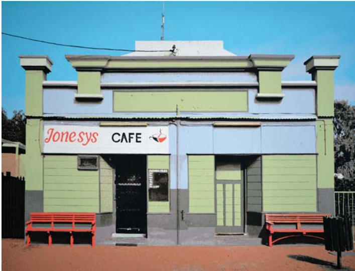
Gray Krüger, Jonesys Café, Acryl, 2018.