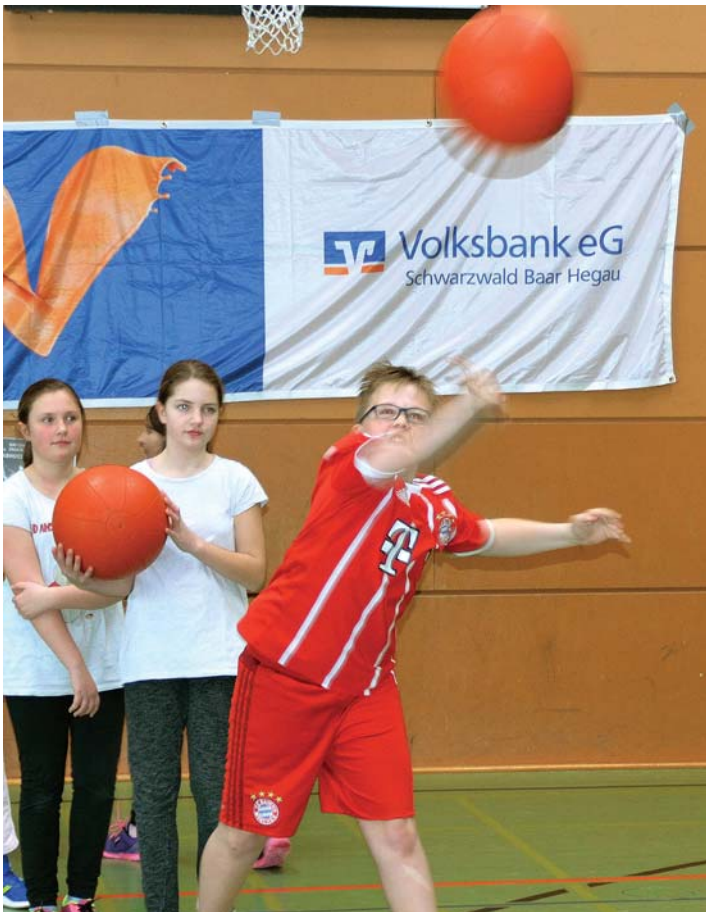
Zum zehnten Mal wetteifern Grundschüler bei der Talentiade in Engen.

Es gibt eine Mannschafts- und eine Einzelwertung. Die beste Schule bekommt einen Gutschein zur Anschaffung von Sportgeräten über 100 Euro. Die besten sechs Kinder qualifizieren sich für das Baden-Finale, um sich dort in einem Mannschaftswettbewerb mit den Besten im Land zu messen.