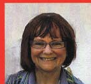
Christa Pfeiffer Uhren / Schmuck