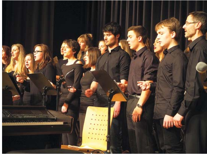
Der A Capella-Chor begeisterte beim Schulkonzert.