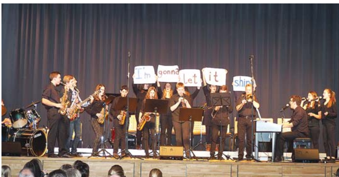
Mit dem Lied »Little light of mine« riss die Bigband beim Schulkonzert die Zuschauer mit.