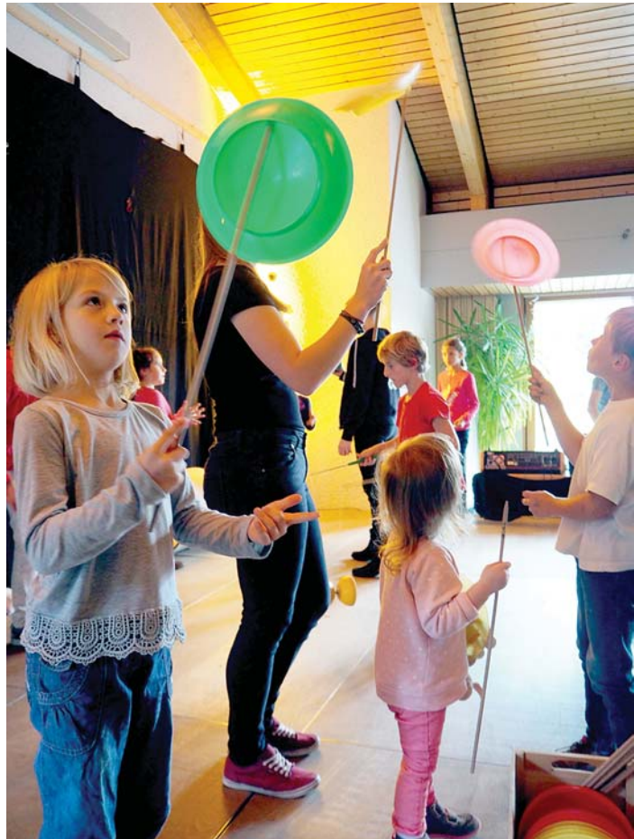
Bühne frei für die Nachwuchsstars: Nach der Vorstellung durften die großen und kleinen Zuschauer selbst ihr Talent - hier beim Teller-Jonglieren - austesten. Auch im Angebot waren Kinderschminken und Henna-Tattoos.

Zum Abschlusstanzen kamen alle Casanietto-Ensemble-Artisten noch einmal auf die Bühne. Die Kerzen auf der Geburtstagstorte wurden übrigens dann doch ohne Feuerwehrschauch gelöscht - der Funke der Begeisterung war schon ans Publikum übersprungen, das sich im Anschluss bei Kuchen, Snacks und Getränken selbst in der Jonglier- und Balancierkunst versuchen durfte. Auch Kinderschminken und der »Henna-Tattoo-Tisch« waren stets umlagert.