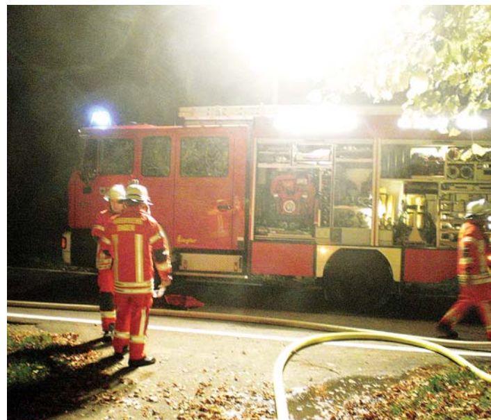
Viel Lob bekam die Bittelbrunner Abteilung der Freiwilligen Feuerwehr Engen bei der Nachbesprechung ihrer Jahreshauptprobe, die traditionell als Nachtübung durchgeführt wurde.