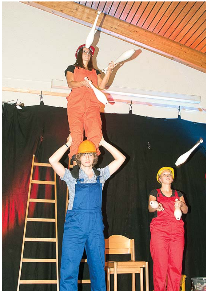
Auch die »Grufties«, ehemalige Casaniettos, zeigten, dass sie ihre Kunststücke noch beherrschen.