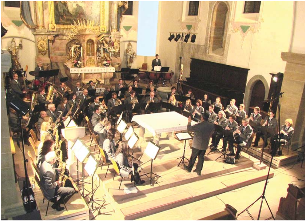
Nach 2012 plant die Stadtkapelle Engen in diesem Jahr erneut ein Kirchenkonzert und lädt am Sonntag, 19. November, um 17 Uhr herzlich in die Engener Stadtkirche ein. Der Erlös des Benefizkonzerts ist für den Hospizverein Singen und Hegau bestimmt.