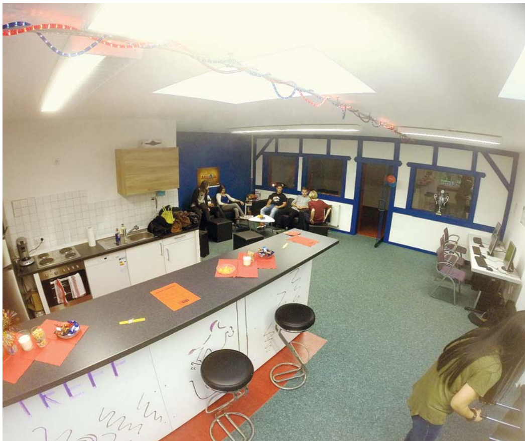
Der neue Jugendtreff am Hexenwegle ist ab sofort immer montags, mittwochs und donnerstags von 16 bis 20 Uhr geöffnet.

Der Gemeinderat Engen befasste sich in seiner Sitzung am Dienstagabend mit der Thematik - der HegauKurier wird in seiner kommenden Ausgabe darüber berichten.