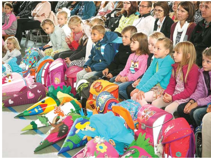
Gespannte Mienen bei der Einschulungsfeier an der Grundschule Welschingen: 26 Schülerinnen und Schüler wurden zum Schuljahr 2015/2016 eingeschult.