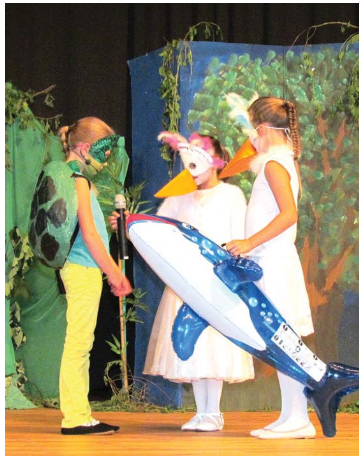
Was soll denn eine Schildkröte, die sich an ihrem Geburtstag nichts sehnlicher wünscht als einen saftigen, grünen Salatkopf, mit dem Fisch anfangen, den ihr die Pelikane als Geschenk bringen? Souverän brachte die Klasse 4a das Theaterstück »Die Schildkröte hat Geburtstag« auf die Bühne.