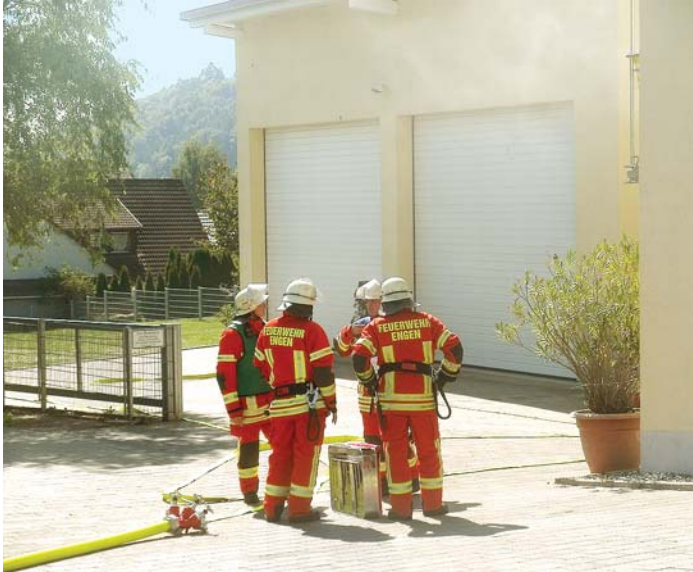
Sehr zufrieden zeigten sich die Übungsbeobachter mit dem Ablauf der Jahreshauptprobe der FFW Anselfingen.