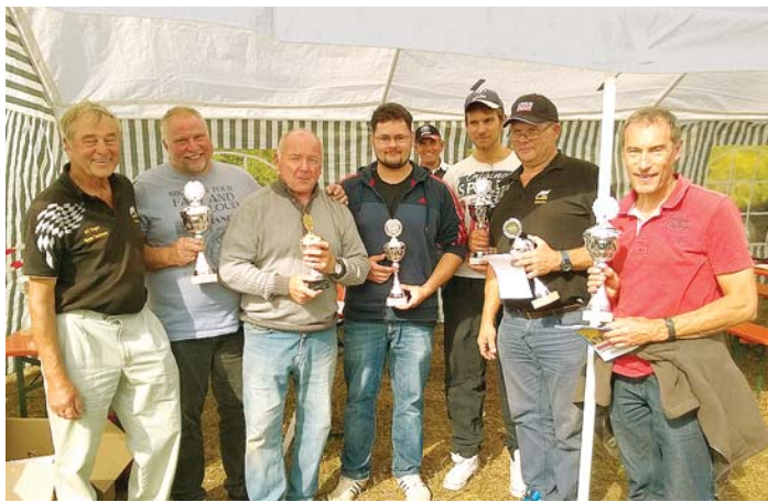
Der Siegerehrung voraus gingen beim Hegau-Slalom spannende Läufe.