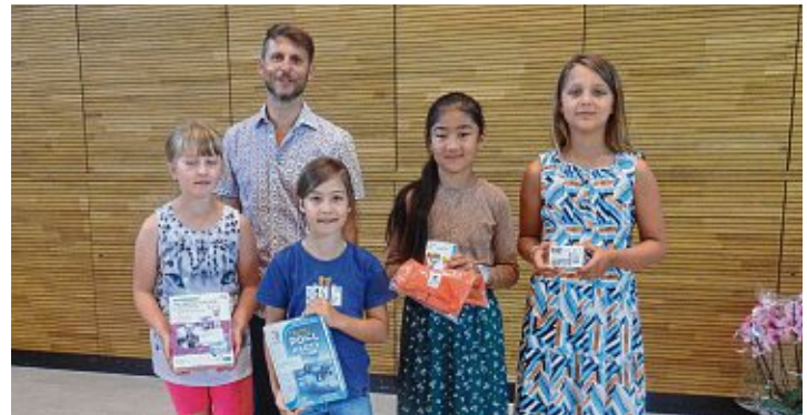
Die glücklichen Gewinnerinnen des Rechenwettbewerbs »Mathe-Känguru«.

Vielfältiges Programm gemeinsam in der Stadthalle