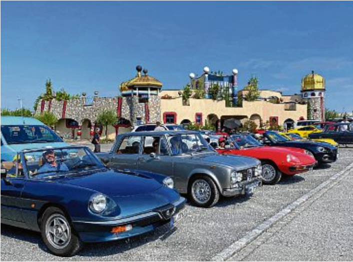
Auch Hundertwasser-Architektur wurde bei der Ausfahrt des Alfaclubs Deutschland/Regionaltreff Bodensee besichtigt.