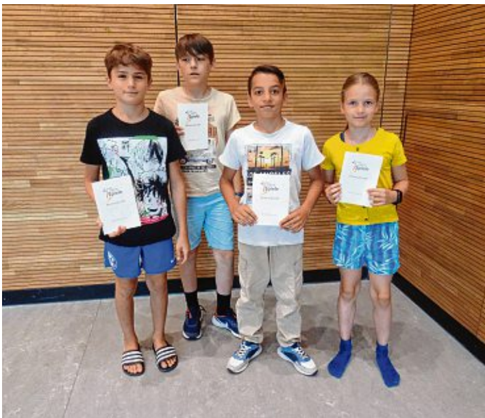
Die Ehrenurkunden der vergangenen Bundesjugendspiele wurden überreicht.