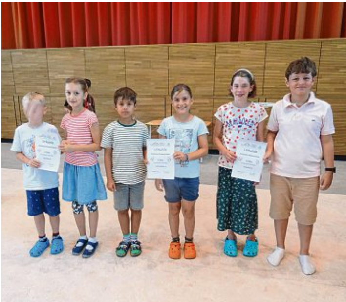
Die Klassensprecher nahmen stellvertretend für die Klassen 3c, 4a und 2a die Urkunde für das schönste Klassenzimmer entgegen.