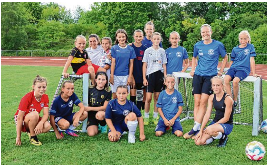
Die glücklichen Spielerinnen mit den beiden Profis.