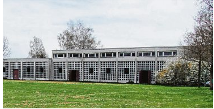
Nach einem Umbau und Einbau von Wohnräumen in Holzständerbauweise könnten in der alten Stadthalle in Engen 60 bis 70 Geflüchtete untergebracht werden.

Im Einvernehmen mit dem Gemeinderat wird Moser dem Landratsamt Konstanz nun signalisieren, dass Landkreis und Stadt bezüglich der alten Engener Stadthalle ins Gespräch kommen könnten.