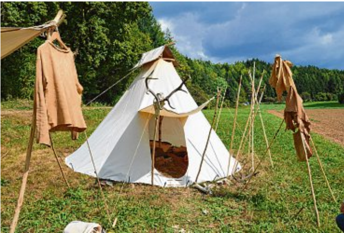
Besucher können in die Steinzeit eintauchen.