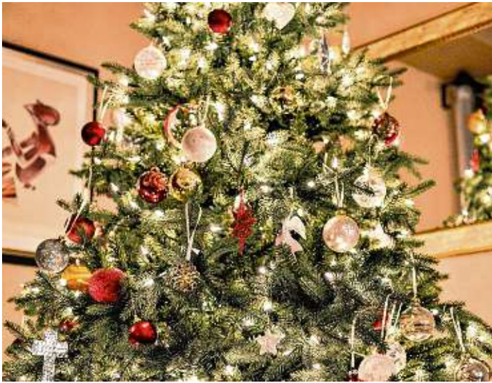
Lametta, Kugeln, Strohsterne und viele weitere Ornamente werden heutzutage an den Weihnachtsbaum gehängt. Früher war das anders.