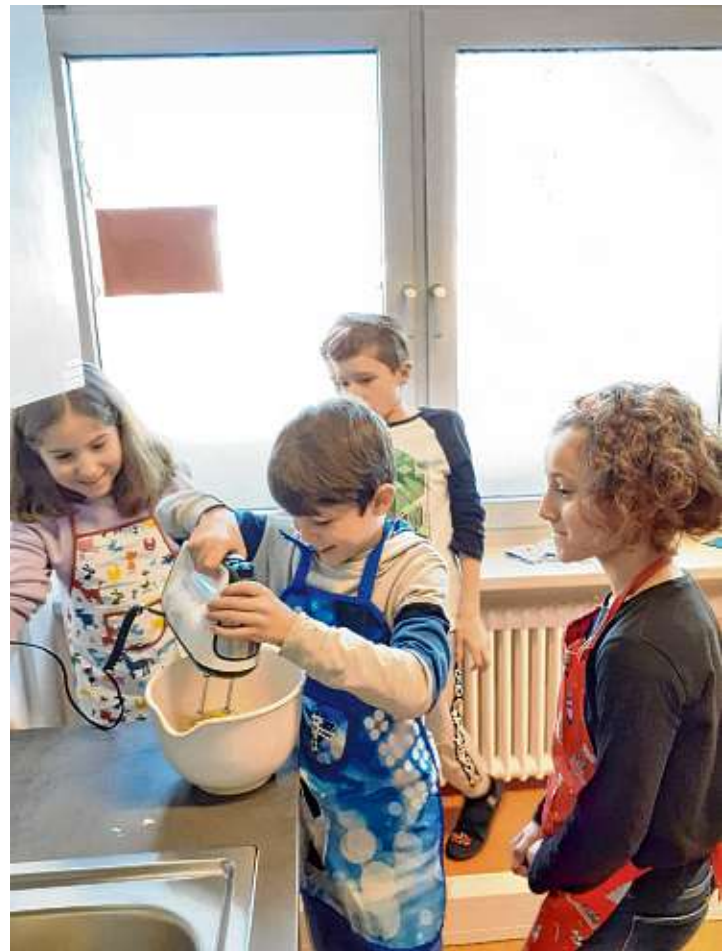
Mit Feuereifer rührten die Drittklässler den Waffelteig.