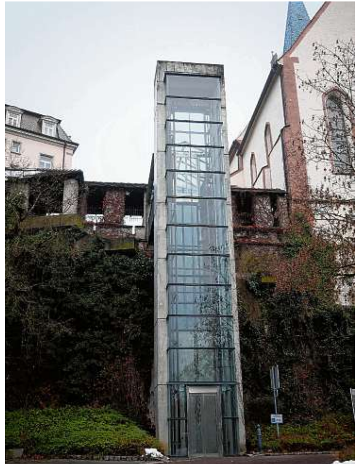
Der Altstadtaufzug ist ab sofort wieder in Betrieb. Die für die Reparatur benötigten Ersatzteile wurden kurzfristig geliefert und konnten am vergangenen Freitag bereits eingebaut werden.

Gelbe Säcke: erhältlich bei Ulla's Stoffidee, Vorstadt 13, vor dem Geschäft. Es sollten nur haushaltsübliche Mengen mitgenommen werden.