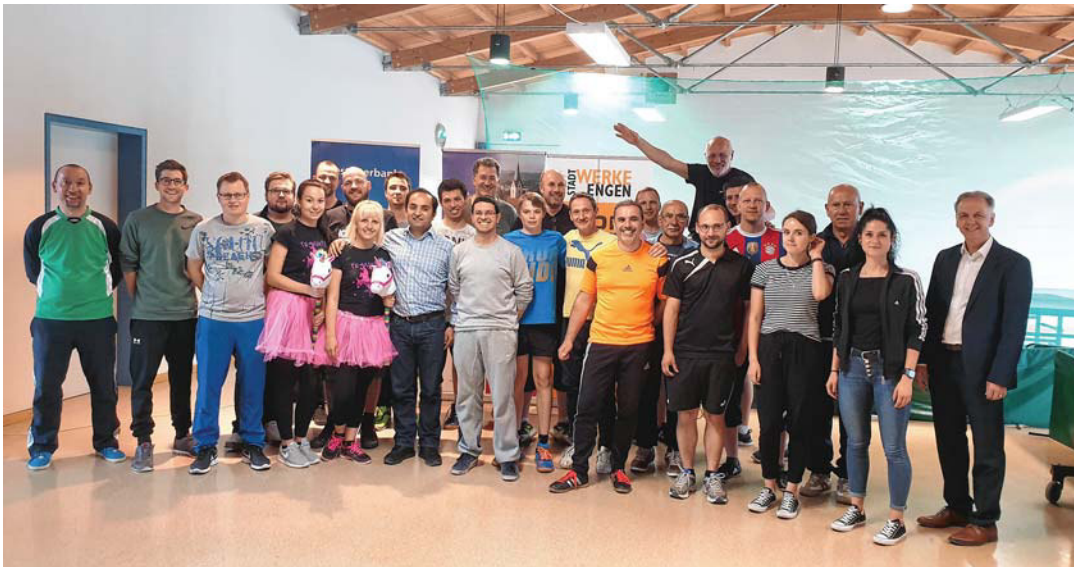
Über das gelungene Grümpeltturnier des Tischtennisvereins Anselfingen freuten sich Organisatoren wie Teilnehmer gleichermaßen.