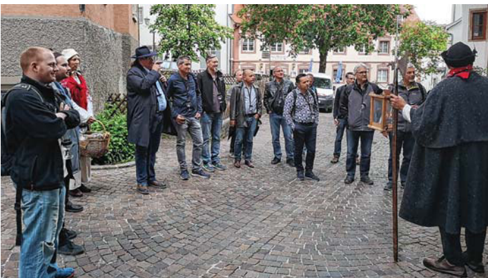
Beim »Whisky-Walk« durch die Altstadt gab es zu den Informationen auch Whisky-Kostproben.