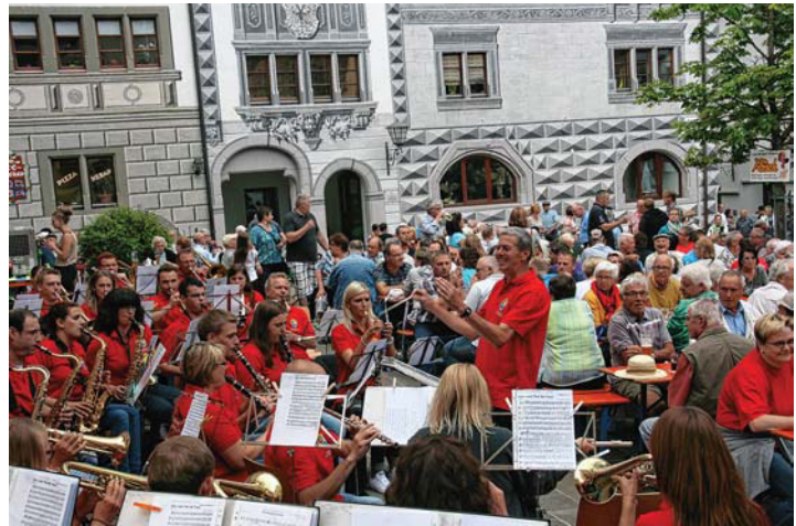
Am 6. Juni beginnen die beliebten Feierabendkonzerte auf dem idyllischen Marktplatz in Engen. Zum Auftakt spielt der Musikverein Welschingen.

psg Presse- und Verteilservice Baden- Württemberg GmbH, kostenlose Hotline: 0800 999 5 222, qualitaet@psg-bw.de