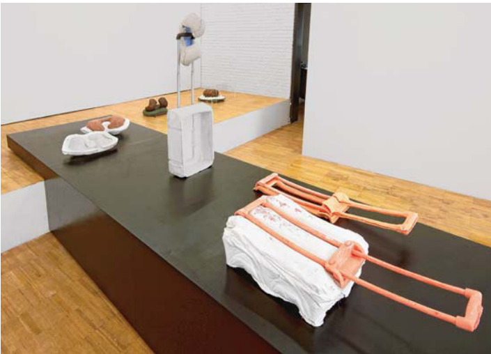
Anna Lena Grau, Abdruck_2Cargo Bay, 2018, Installation.