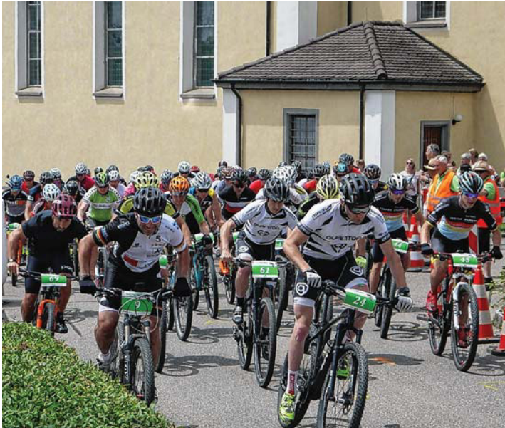
Spannende Rennen sind am 2. Juni beim zehnten Neuhauser Cross-Country-Rennen für Hobbyfahrer zu erwarten.