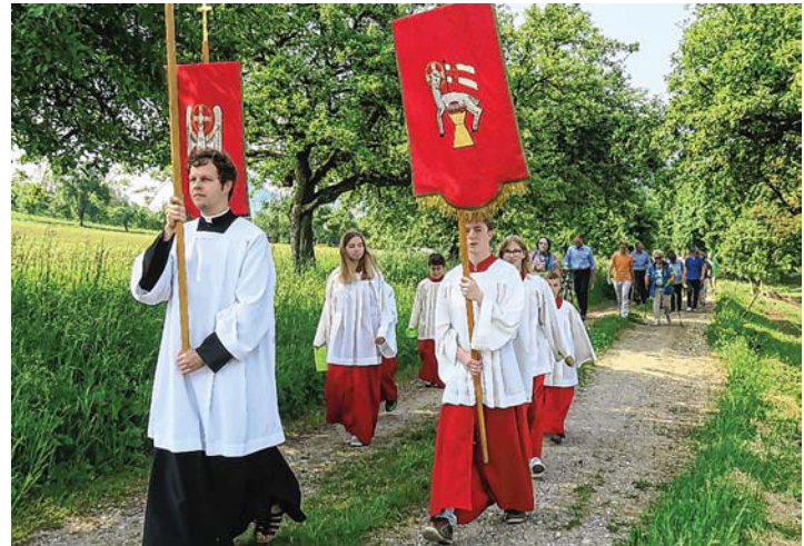
Vor dem gemeinsamen ökumenischen Gottesdienst der katholischen Pfarrgemeinden Mühlhausen, Ehingen und Aach sowie der evangelischen Kirchengemeinde Aach-Volkertshausen auf dem Waldhof findet an Christi Himmelfahrt, morgen, Donnerstag, 30. Mai, eine Bittprozession statt.

Sollten die Wetteraussichten unsicher oder gar schlecht sein, läuten die Glocken um 10 Uhr in jeder Gemeinde, und der gemeinsame Gottesdienst findet dann um 10.30 Uhr in der Pfarrkirche St. Nikolaus in Aach statt.