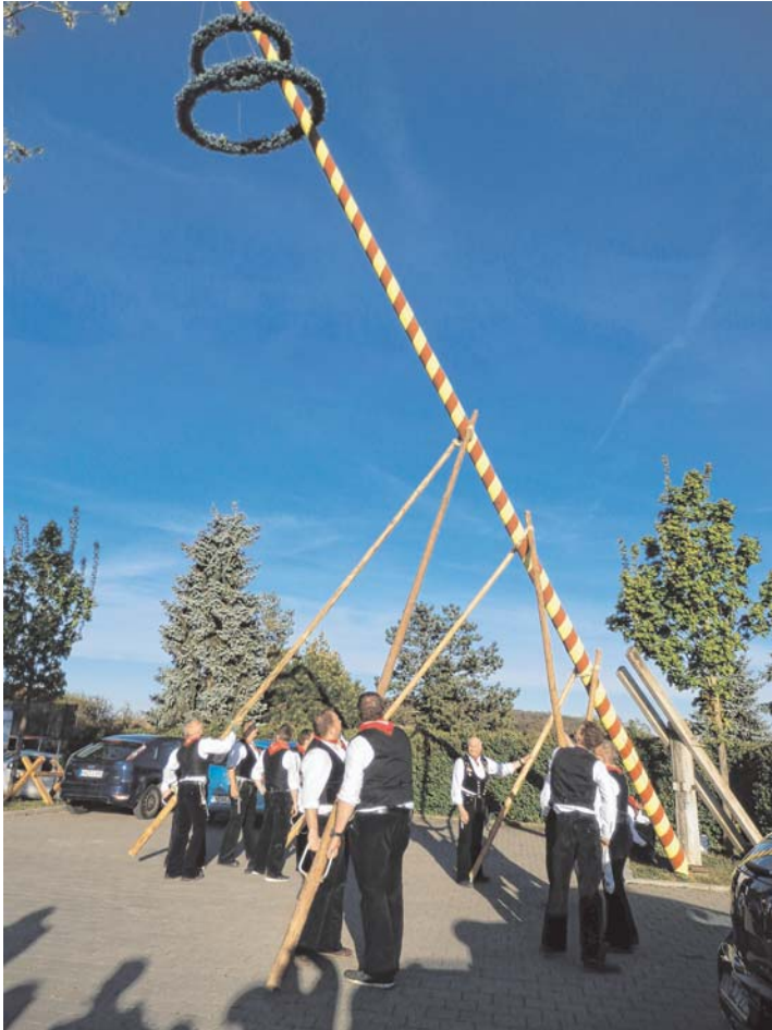
Das Stellen des Maibaumes durch die Zimmermänner des Narrenvereins Hasenbühl bildet traditionell am Dienstag, 30. April, um 19 Uhr den Auftakt für das Maifest des Musikvereins Anselmingen.