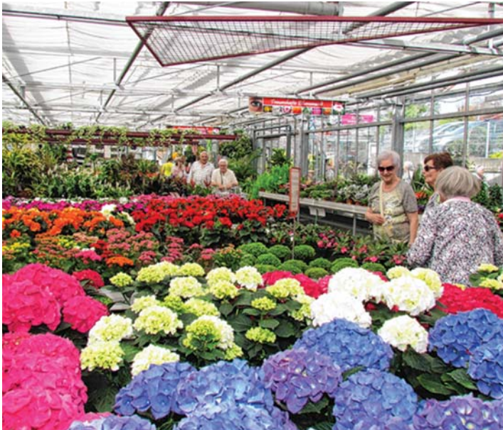
Zu einem »Tag der offenen Gärtnerei« lädt Blumen Weggler im Rahmen des Altdorf-Erlebnis-Sonntags ein und präsentiert eine breite Vielfalt an Floristik und Pflanzen.