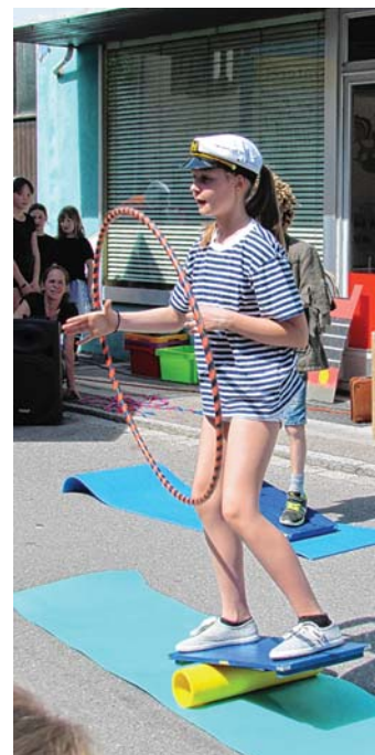
Auftritte des Circus Casanietto des TV Engen gehören schon zur lieben Tradition beim Altdorf-Erlebnis-Sonntag.

Verantwortung für unsere Umwelt Kamenzin - Engen 07733 - 1718 Heizung - Sanitär - Solar www.kamenzin-haustechnik.de