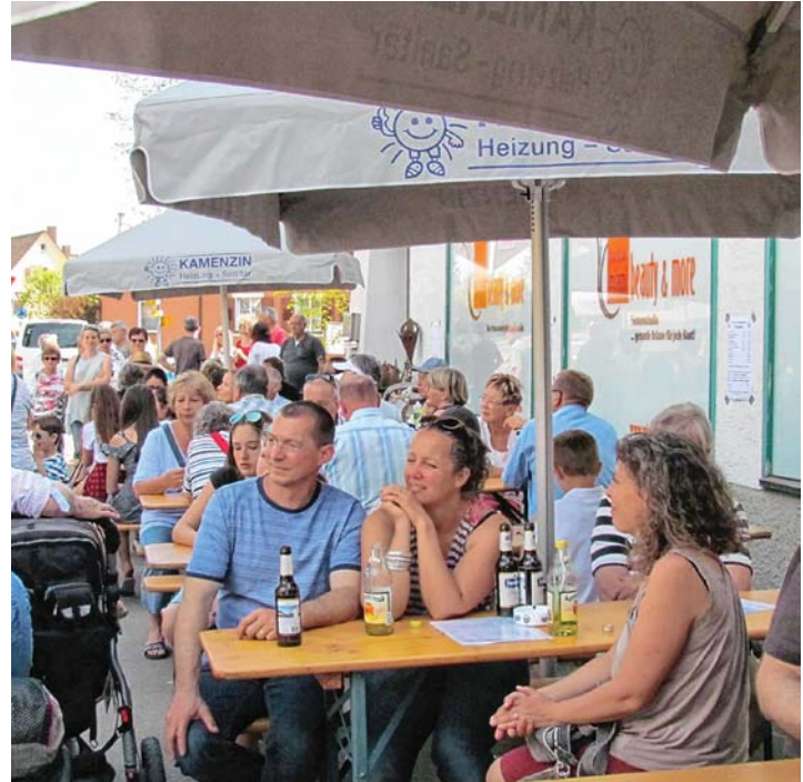
Für leckere herzhaft oder süße Bewirtung ist beim Altdorf-Erlebnis-Sonntag an mehreren Stellen gesorgt.