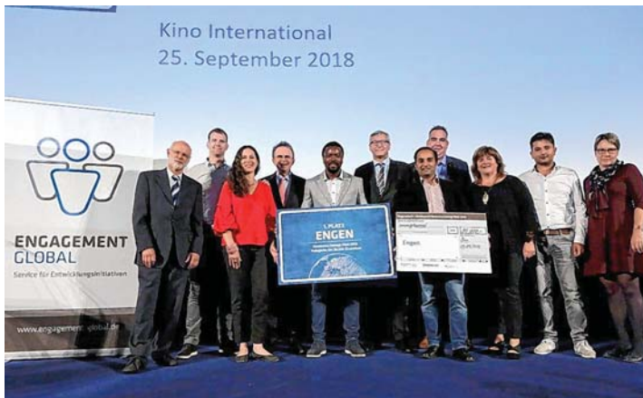
Das Projekt »Unser buntes Engen« wurde nicht nur landes-, sondern sogar bundesweit ausgezeichnet.