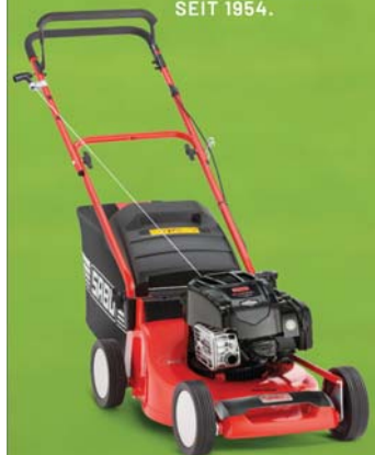
SABO 43-COMPACT SM