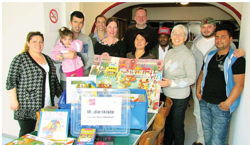
Zum sozialen Engagement des Fördervereins der Stadtbibliothek Engen zählte im vergangenen Jahr auch die Übergabe einer Medienkiste für Asylsuchende im Wert von 300 Euro.