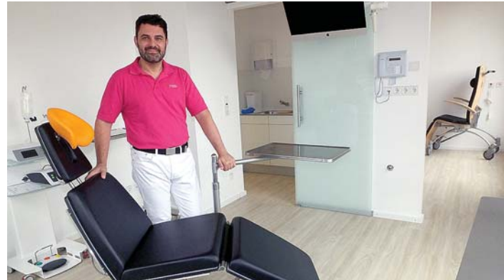
Die Behandlungszimmer sind modern und großzügig gestaltet.

– Blecherei – Industriebau – Dach und Fassade – Lüftungsbau