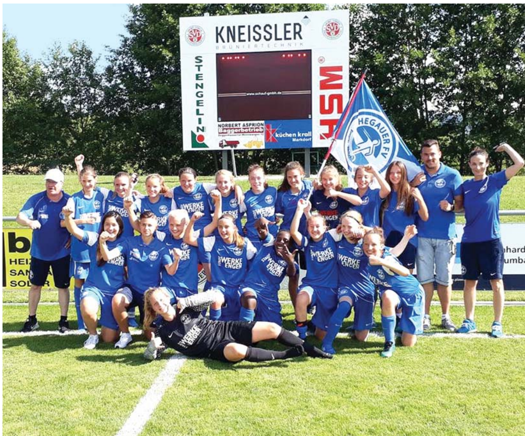
Auch die B2-Juniorinnen zählen zu den vier Meisterteams des Hegauer FV. Sie dürfen stolz sein, Meister der Kreisliga geworden zu sein.

Am Ende gab es gegen den SV Orsingen-Nenzingen 2 einen 3:2-Sieg.