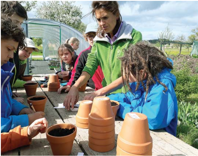
Minigärtner Hegau bei der Arbeit.