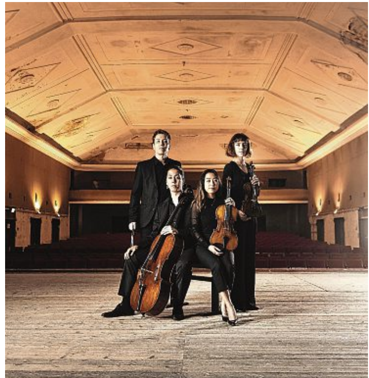
Das international ausgezeichnete »Leonkoro Quartet« tritt auf Einladung der Stubengesellschaft Engen am Dienstag, 20. September, um 20 Uhr im Städtischen Museum Engen + Galerie auf.

im Vorverkauf bei der Buchhandlung am Markt und bei Schreibwaren Körner sowie an der Abendkasse