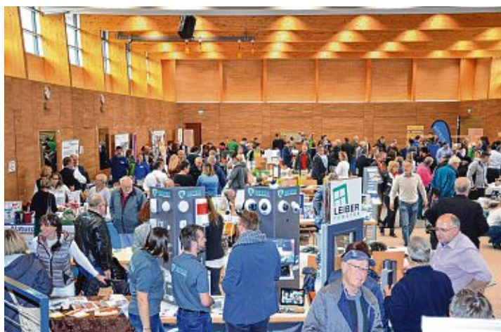
Treffpunkt der Wirtschaft: Bei der 12. Engener Info-Börse präsentieren Betriebe und Institutionen der Region ihre Produkte und Dienstleistungen.