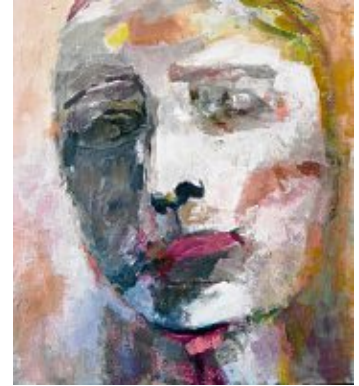
Lydia Leigh Clarke, »under the selfsame sky«, Pigmente und Bienenwachslasur, 2020.

Lydia Leigh Clarkes Kunst entwickelt sich an der Grenzlinie von abstrakter und gegenständlicher Malerei. Dabei ist zu beobachten, mit welcher Leichtigkeit sie diese Grenze in die eine oder in die andere Richtung über-