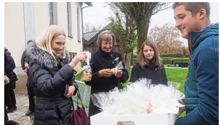
Der Jugendgemeinderat verteilte kleine Plätzchen in Form von Friedens-tauben an die Anwesenden.