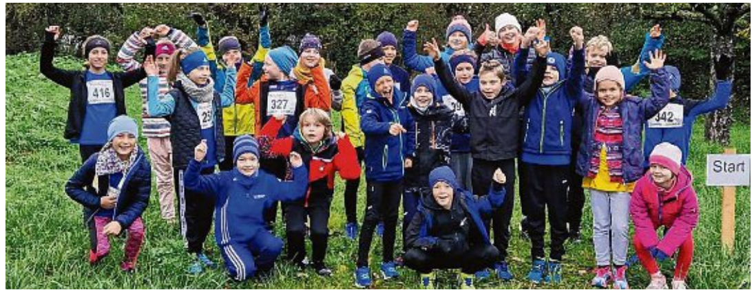
24 Kinder und Jugendliche des TV Engen stürmten auf der Insel Reichenau durch die abgesteckte Crosslaufstrecke - sie sammelten dabei Erfolge und neue Erfahrungen.

Informationen unter: Stiftung Liebenau, Betreutes Wohnen in Familien (BWF), Worblinger Straße 63, 78224 Singen, Telefon 07731/596962, www.stiftung-liebenau.de/teilhabe .