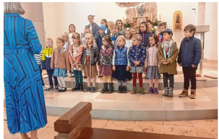
Der Kinderchor MGV Badenia beim Benefizkonzert.

Musik unterstützt Kinder- und Jugendhospizarbeit