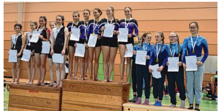
SiegerInnen-Ehrung der Besten aus Wettkampf 7, LK4 jahrgangsgemischt.

Wochenmarkt Jeden Donnerstag von 8 bis 12 Uhr auf dem Marktplatz