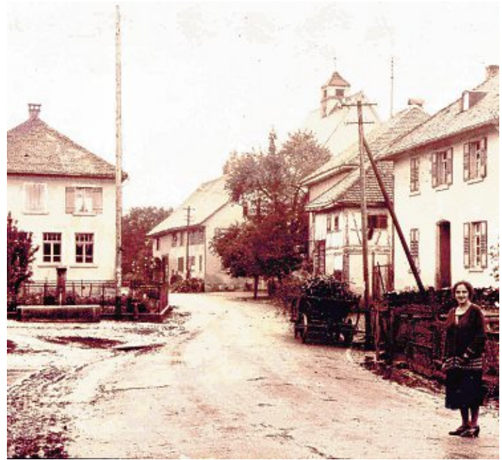
Auf den Spuren jüdischen Lebens - hier eine historische Aufnahme aus Wangen am See.