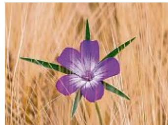
Das Ackerwildkraut »Kornrade« ist selten geworden.

den. Die zarten Pflänzchen können sich aber nur entwickeln wenn sie sich am Hafer »festhalten« können. Eiweißhaltige Pflanzen werden im Hinblick