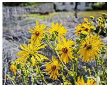
Alternative zu Mais: Der Boden erodiert bei der »Silphie« nicht. Wie Mais kann sie siliert oder als Energiepflanze genutzt werden.