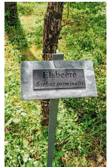
Beschriftung im Arboretum.

orientierte Regionalentwicklung in naturschutzfachlich hochwertigen Landschaften an. Die PLENUMs-Fläche ist von der Standortsgüte als »mäßig trockener Nagelfluhlehm« eingestuft. Auch hier haben die beteiligten Forstwirte knapp 3.000 Tubexrohre abgebaut und die von Weiden bedrängten Bäumchen wieder freigestellt. Die Maßnahme bezeichnet man in der Forstwirtschaft als »Jungbestandspflege«.