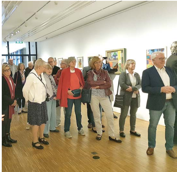
Besucher der Vernissage im Stadtmuseum Hofheim.

»Die Ausstellung«, berichtet Wagner, »wird in zwei großen Räumen gezeigt, ganz anders als in unserem ehemaligen Kloster St. Wolfgang, aber nicht weniger beeindruckend. Die Bilder hängen nun dichter und entwickeln dadurch ganz andere Beziehungen zueinander und zum Betrachter. Allein schon wegen des Vergleichs der Raumwirkungen lohnt es sich, nach Hofheim zu fahren«. Und Engen sei durch die Ausstellung nun auch in Hessen in aller Munde, so Wagner mit einem Augenzwinkern. Die Ausstellung wird noch bis zum 11. Februar 2018 im Stadtmuseum Hofheim gezeigt.