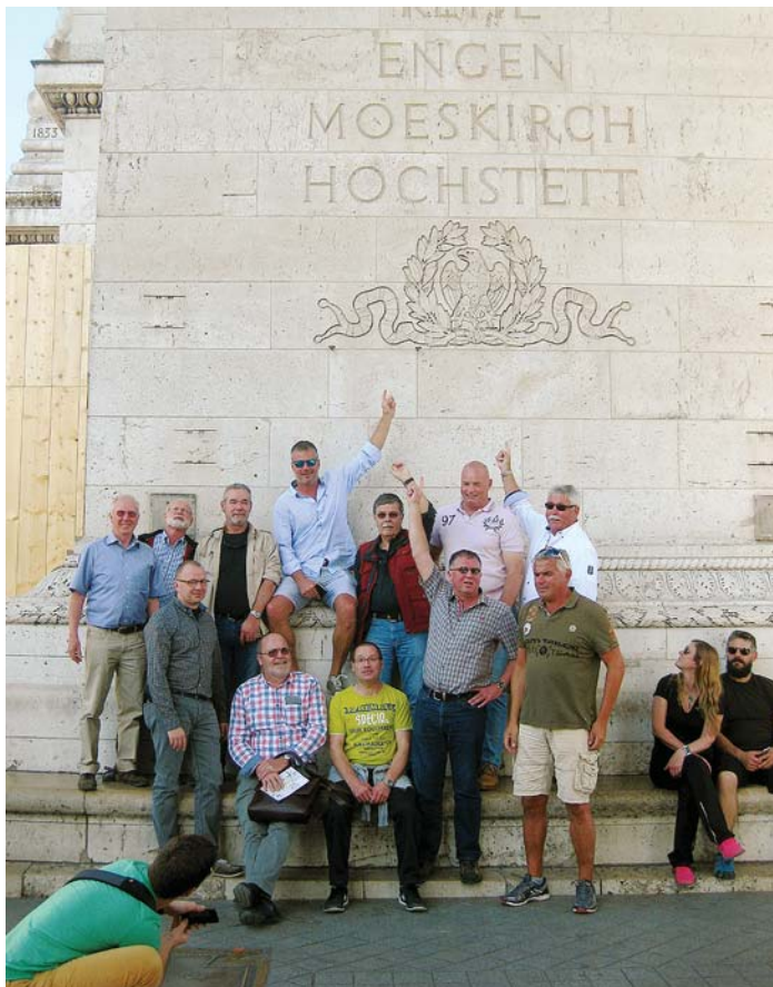
Die Bürgerwehr stellte sich dem Fotografen vor dem Arc de Triomphe unter der Inschrift von Engen.