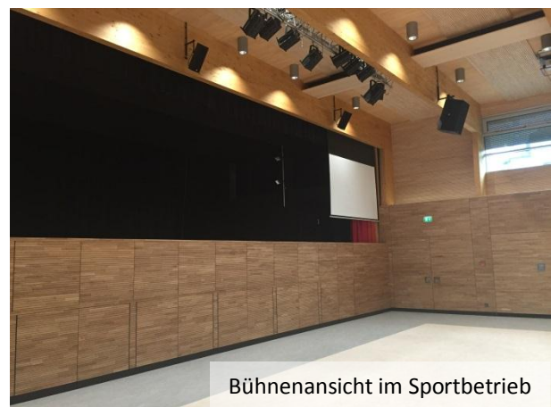
Bühnenansicht im Sportbetrieb

Die Bühnenanlieferung (Position A) ist gut mit einem Transporter oder kleinem LKW zu erreichen.