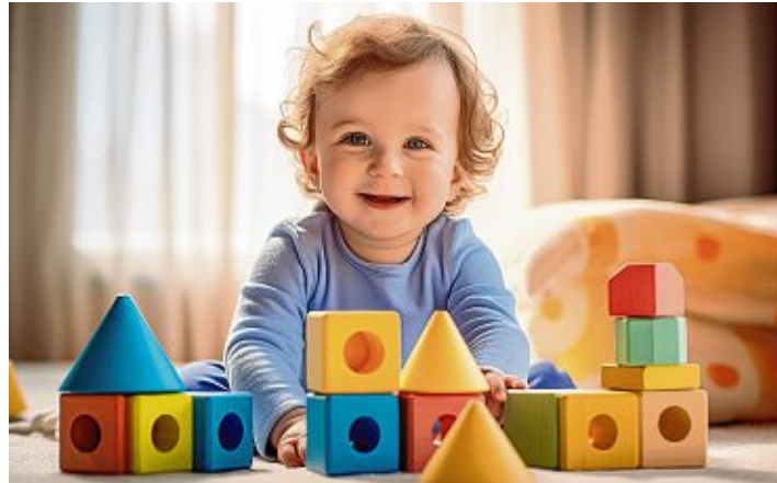
Bitte natürlich: Gerade Spielzeug für Babys und Kleinkinder sollte aus nachhaltiger Produktion stammen.

Die Auswahl an Spielzeug aus biobasierten Kunststoffen ist inzwischen ziemlich groß. Holzspielzeug eignet sich mit seinen haptischen Eigenschaften besonders für Kleinkinder. Aber nicht jedes Holzspielzeug ist auch nachhaltig: Beim Kauf sollten Eltern und Großeltern darauf achten, dass das verwendete