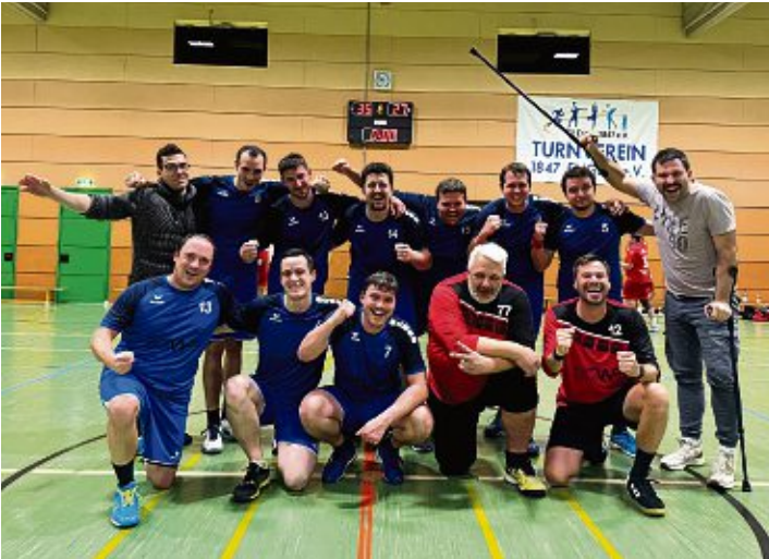
Strahlende Gewinner: Die Handballer vom TV Engen auf Erfolgskurs.

TV Engen Handballer punkten auch gegen Radolfzell