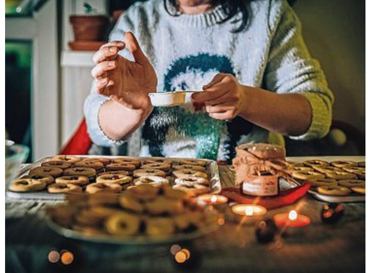
Auch beim Backen gilt: Weniger ist oft mehr.

Wer sich dadurch gestresst fühlt, sollte die eigenen Ansprüche überdenken. Es muss nicht alles perfekt sein. Und Pläne können geändert werden.