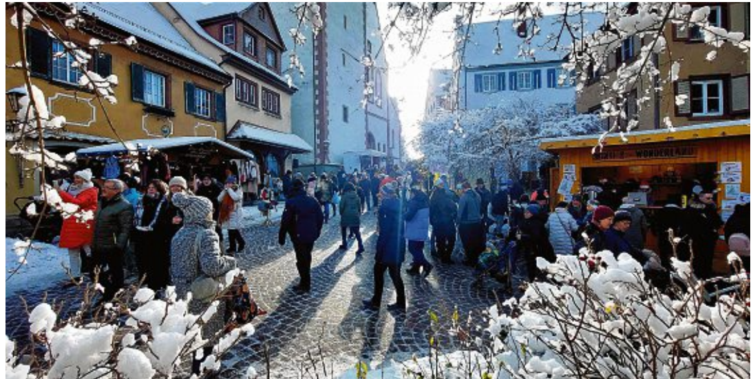
Beliebt bei Alt und Jung: Am Wochenende geht es auf den stimmungsvollen Engener Weihnachtsmarkt!