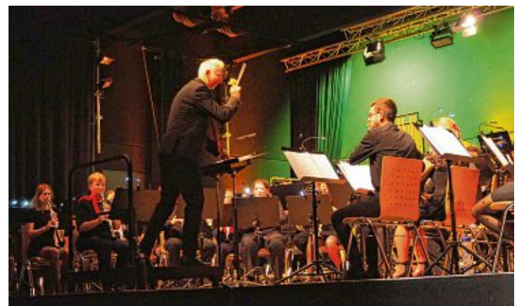
als auch die Stadtmusik dirigiert. Beide Kapellen nahmen das Publikum mit auf eine Reise durch magische Klangwelten.