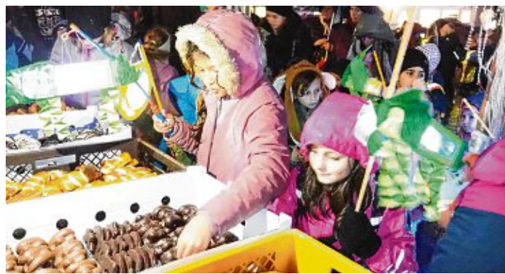
Naschereien für die Kinder: Nach dem Laternenumzug gibt es traditionell Lebkuchen oder Laugenteile auf dem Marktplatz.

Um die besondere Atmosphäre dieser Veranstaltung ungestört genießen zu können, ist die Altstadt an diesem Abend in der Zeit von 16:30 Uhr bis 20 Uhr für den Fahrzeugverkehr gesperrt. Die Geschäfte der Altstadt haben an diesem Abend von 17 bis 20 Uhr geöffnet und freuen sich auf zahlreichen Besuch.