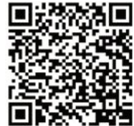
SEPA Erteilung Online

Bei Fragen zur Steuerberechnung steht das Steueramt (Telefon 07733/502-232) gerne zur Verfügung.