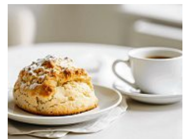
Der Verein »Unser buntes Engen« lädt von 17 bis 20 Uhr in die Begegnungsstätte »Engener Brücke« ein zu Tee und selbst gebackenen, original englischen Scones.