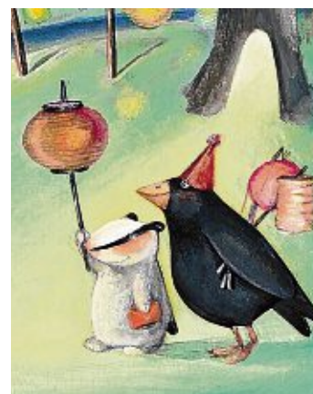
Der Dachs und seine Freunde.

Engen. Die Trachtenfrauen treffen sich wieder heute, Mittwoch, 13. November, um 19.30 Uhr in der Raststätte Hegau West.