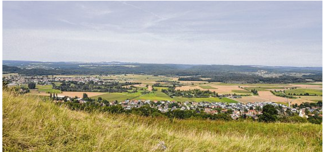
Der Hegau vor der Tür - Blick auf Mühlhausen-Ehingen vom Mägdeberg aus.

Hegau (rau). Das war ein Jahr! Mit vielen Veranstaltungen seit Januar wurde in Mühlhausen-Ehingen kräftig gefeiert und das Motto »ZWEI Orte – EINE Gemeinde – UNSERE Heimat« greifbar gemacht. »Wir haben dieses Motto ganz besonders intensiv miteinander