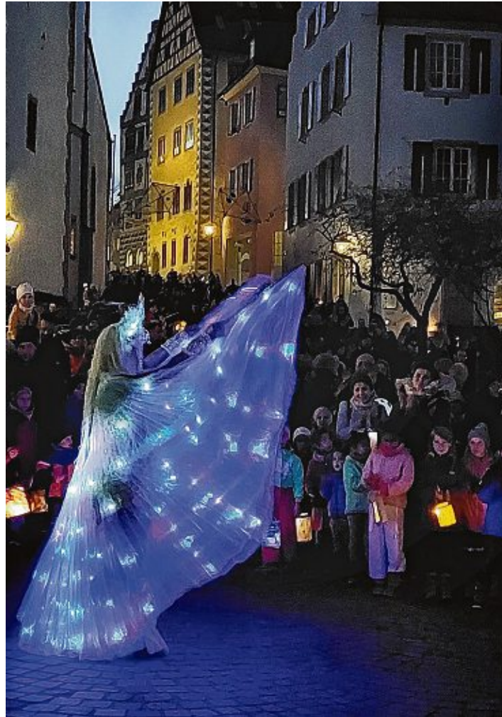
Lichterabend in der Engener Altstadt: Das stimmungsvolle Event für Groß und Klein.

Weitere zahlreiche Aktionen lassen den Lichterabend für Groß und Klein zum Erlebnis werden: Der traditionelle St. Martins-Laternenumzug für Kinder startet um 17 Uhr auf dem Marktplatz und wird durch eine Bläsergruppe der Stadtmusik Engen musikalisch begleitet. Auch die Stadtbibliothek ist bis 20 Uhr geöffnet und jeweils um 17:45 Uhr und 18:30 Uhr wird das Puppenspiel »Das Laternenmädchen« aufgeführt. Um 18 und 19 Uhr (jeweils 20 Minuten) erfüllt der