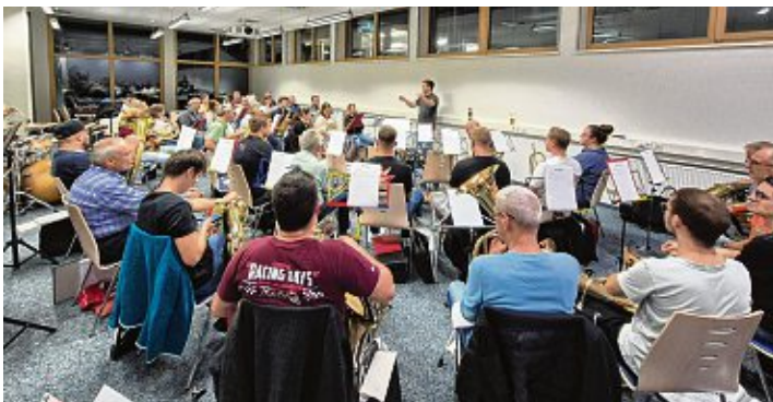
Bei einem Probenwochenende in der Jugendherberge Überlagen haben sich die MusikerInnen intensiv auf das Konzert vorbereitet.

Jahreskonzert MV Welschingen am 16. November