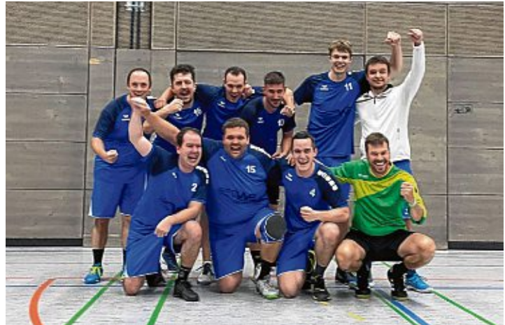
So sehen Sieger aus: Die Handballer vom TV Engen

Herren gewinnen auch das Rückspiel gegen Blumberg.