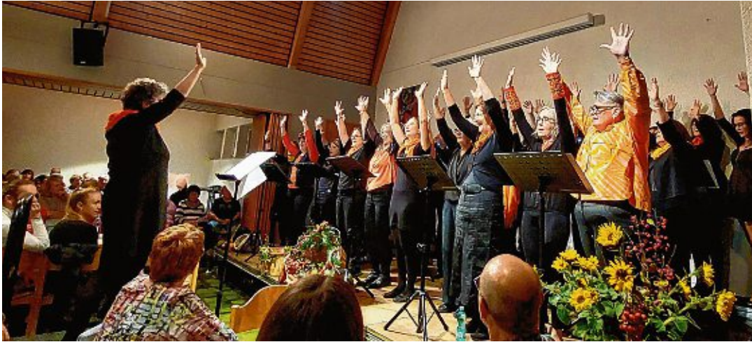
Mit vollem Einsatz bei der Sache: Die Freudenfunken, welche der Chor »Querbeet« auf der Bühne versprühte, sprangen sofort auf das Publikum über.

Chor »Querbeet« brachte mit seinem Konzert das Publikum zum Strahlen