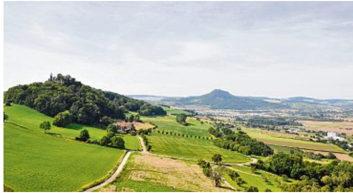
Eine vitale Gemeinde im Hegau: Mühlhausen-Ehingen hat viel zu bieten.

Hegau. Die beiden Dörfer Mühlhausen und Ehingen im Hegau wurden im Jahre 787 erstmals urkundlich in einer Schenkungsurkunde des Klosters St. Gallen genannt. 1805 - beziehungsweise 1810 - wurden die beiden Dörfer dem Großherzogtum Baden eingegliedert. Die Nachkriegszeit brachte eine völlige Neustrukturierung des Ortes. Bei der Gemeindereform