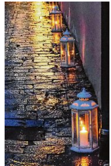
Beleuchtete Laternen in den Gassen sorgen für Atmosphäre.

Bruder den Platz verzaubern. Auch für das leibliche Wohl wird durch die örtliche Gastronomie gesorgt sein und der Schwarzwaldverein bietet im Sudhaus Besichtigungsmöglichkeit und Bewirtung an.